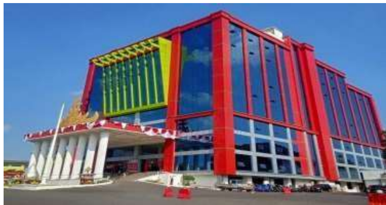
Badan Pendapatan Daerah Kota Bandar Lampung.

Badan Pendapatan Daerah, merupakan perangkat daerah yang beroperasi di bawah naungan pemerintah provinsi dengan tanggung jawab utama mengelola sektor fiskal daerah. Instansi ini bertugas menghimpun