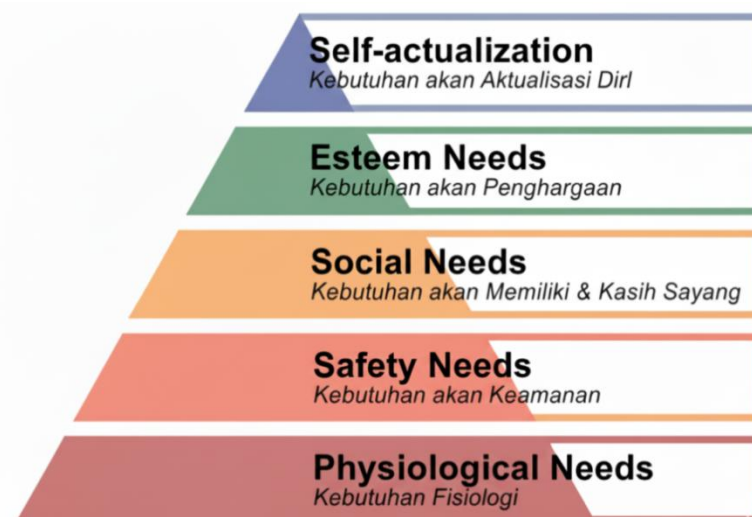
Gambar 2.1. Teori Abraham Maslow

2021) menjelaskan bahwa motivasi manusia berkembang melalui tahapan kebutuhan yang tersusun secara berjenjang, dimulai dari kebutuhan yang paling dasar hingga kebutuhan tertinggi. Dalam teori kebutuhan Abraham Maslow terdapat 5 tingkat kebutuhan yang akan dicapai. Menurut Maslow dalam Aniyati (2023 : 72) tingkat kebutuhan paling bawah adalah kebutuhan fisiologis dan yang paling atas adalah kebutuhan aktualisasi diri. Dengan demikian, pembahasan dari kebutuhan fisiologis sampai aktualisasi diri menjadi penting untuk menjelaskan bahwa keberhasilan guru dalam membina kegiatan ekstrakurikuler musik tidak hanya terlihat dari kemampuan siswa memainkan musik, tetapi juga dari tumbuhnya rasa nyaman, aman, percaya diri, kebersamaan, dan kesempatan siswa untuk mengembangkan bakat serta kreativitas bermusiknya. Berikut ini merupakan gambaran teori kebutuhan Maslow;