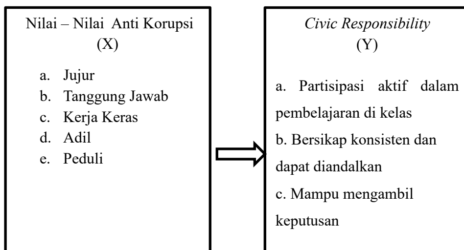
Gambar 2.1 Kerangka Berpikir

Dengan demikian kerangka berpikir dalam penelitian ini dapat digambarkan sebagai berikut :