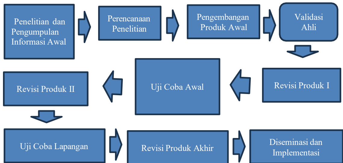
Gambar 3.1 Langkah-langkah penggunaan metode Research and Development (R&D) menurut Borg and Gall

Berikut sepuluh langkah strategis dalam penelitian dan pengembangan (Borg & Gall, 1983).