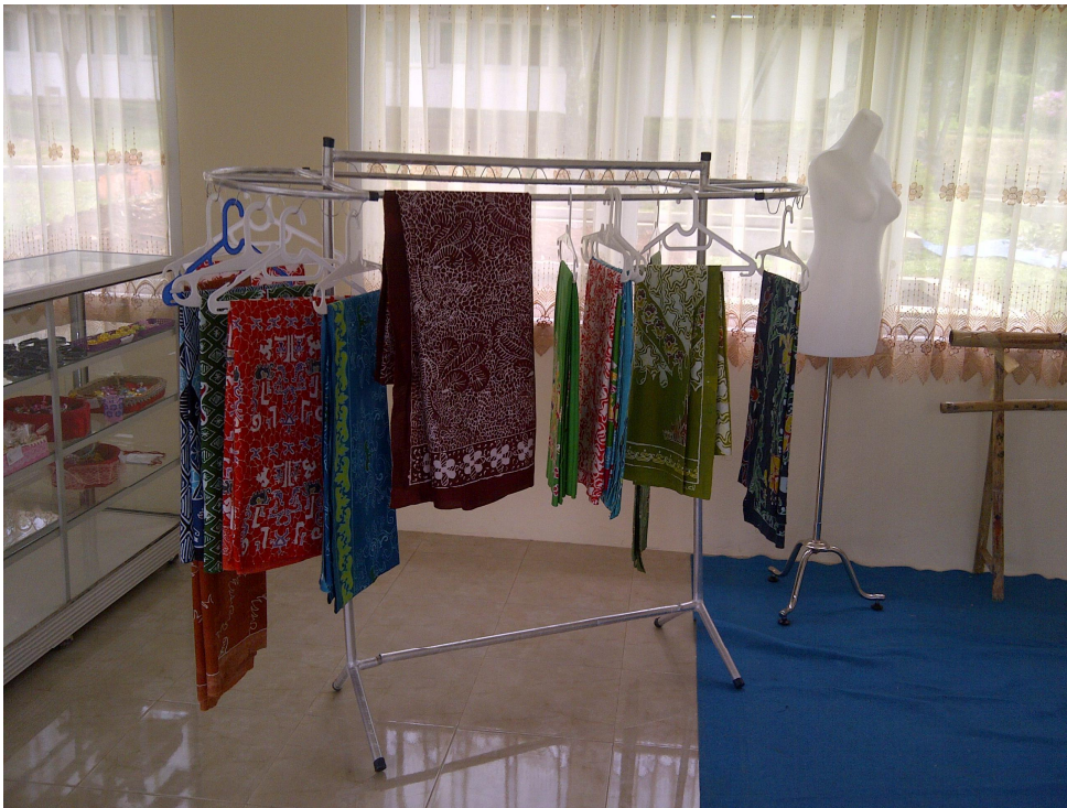
Keterangan: Hasil kerajinan membatik (Dokumentasi oleh Gianti Marisa)