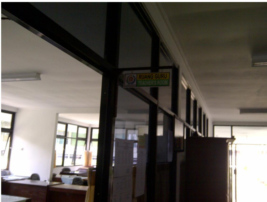
Keterangan: Ruang Guru ( Dokumentasi oleh Gianti Marisa)