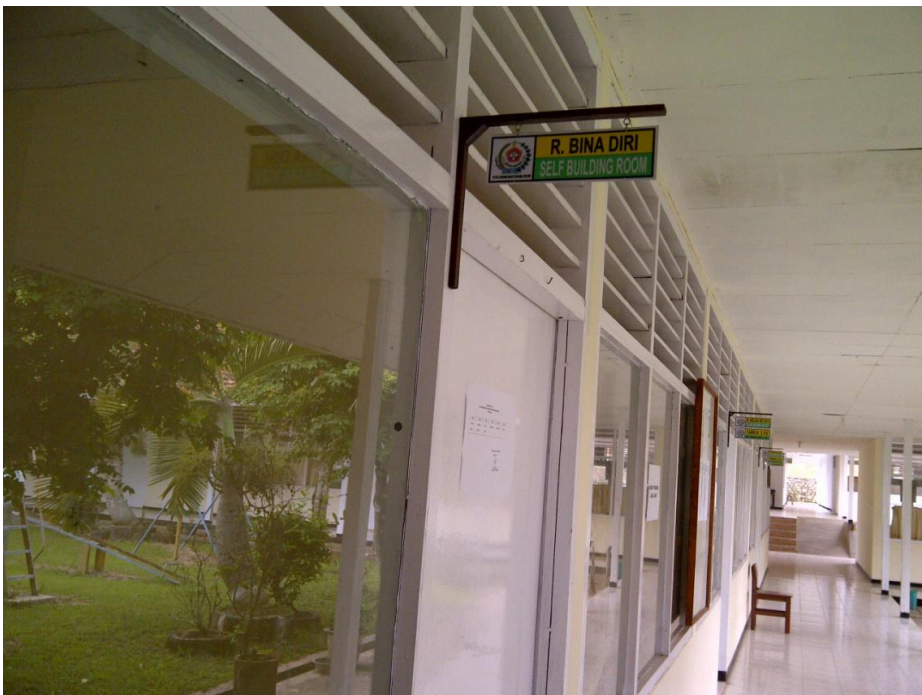
Keterangan: Ruang Bina Diri