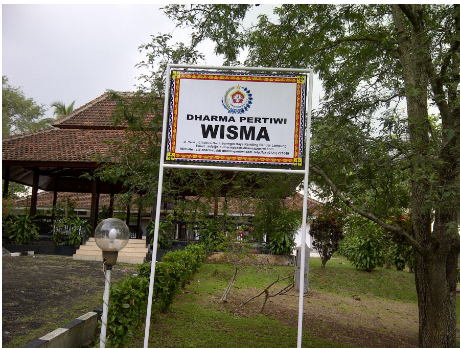
Keterangan: Wisma