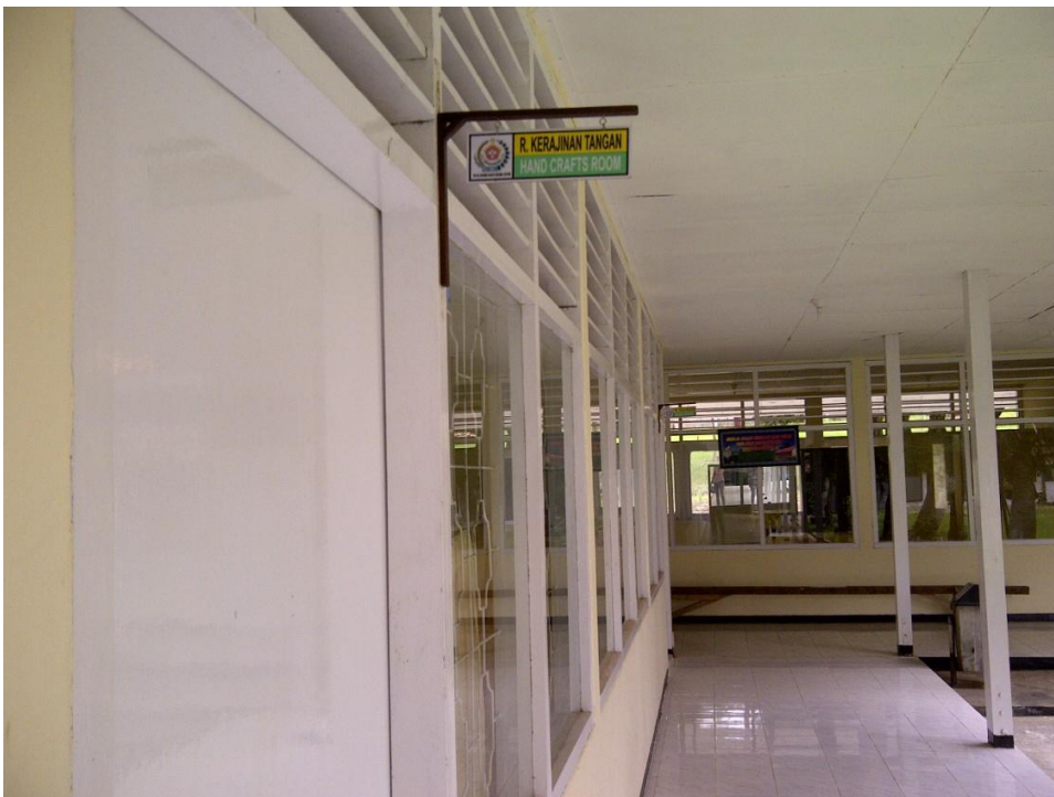
Keterangan: Ruang Kerajinan Tangan