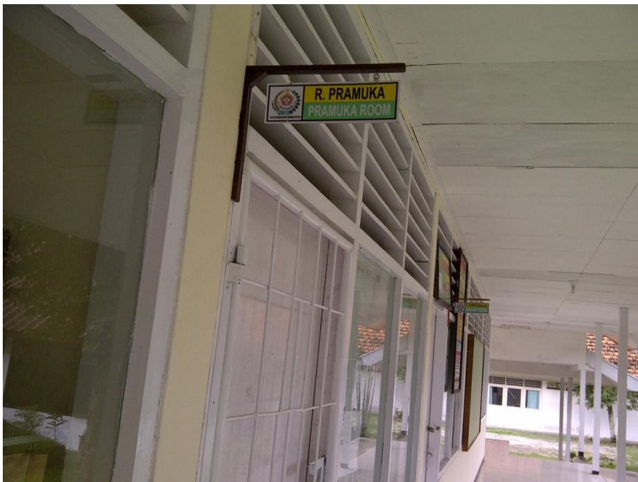
Keterangan: Ruang Pramuka