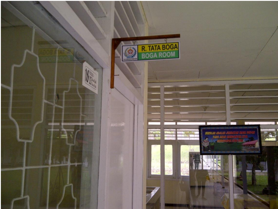
Keterangan: Ruang Tata Boga