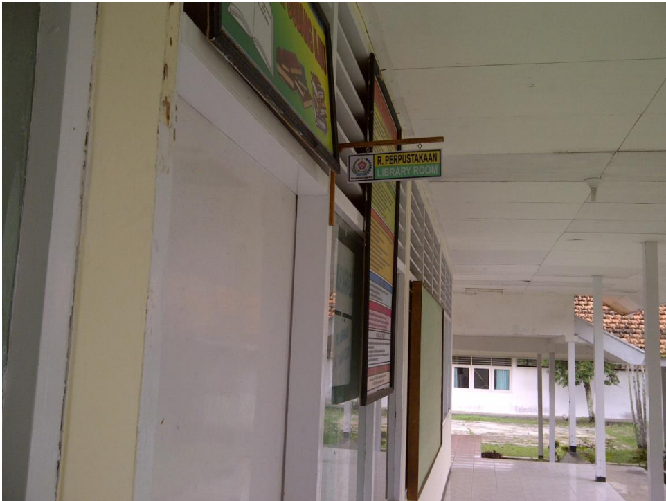
Keterangan: Ruang Perpustakaan