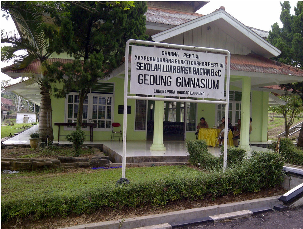
Keterangan: Gedung Gimnasium