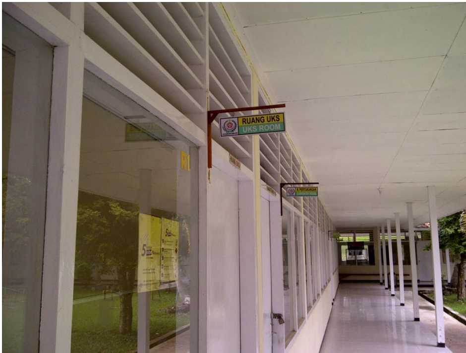
Keterangan: Ruang UKS