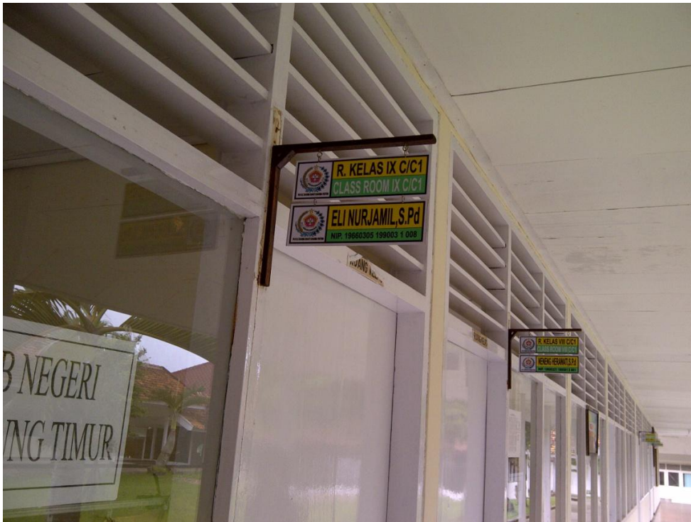
Keterangan: Ruang Kelas IX C/CI