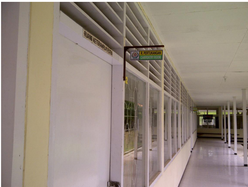
Keterangan: Ruang Pertukangan