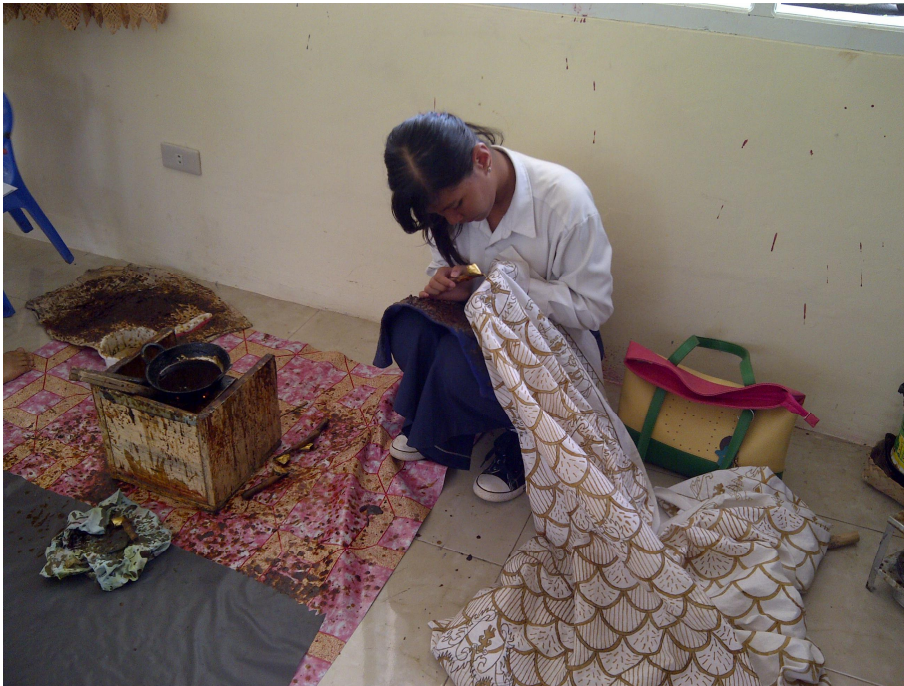
Keterangan: Siswi Tunagrahita dalam membatik