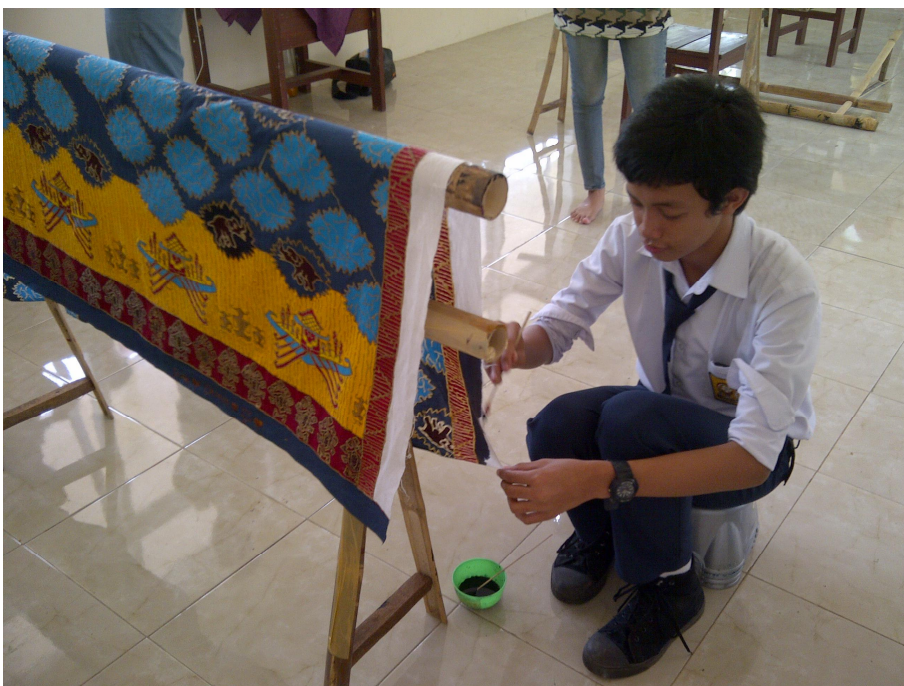
Keterangan: Siswa Tunagrahita dalam membatik