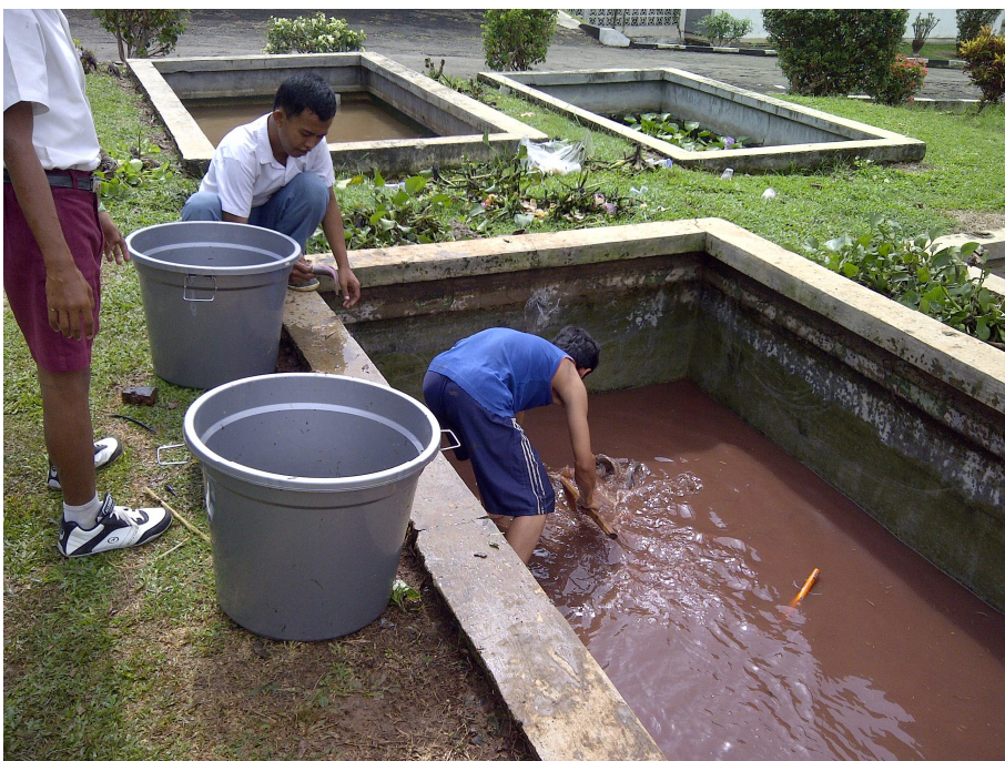
Keterangan: kegiatan perikanan siswa SLB