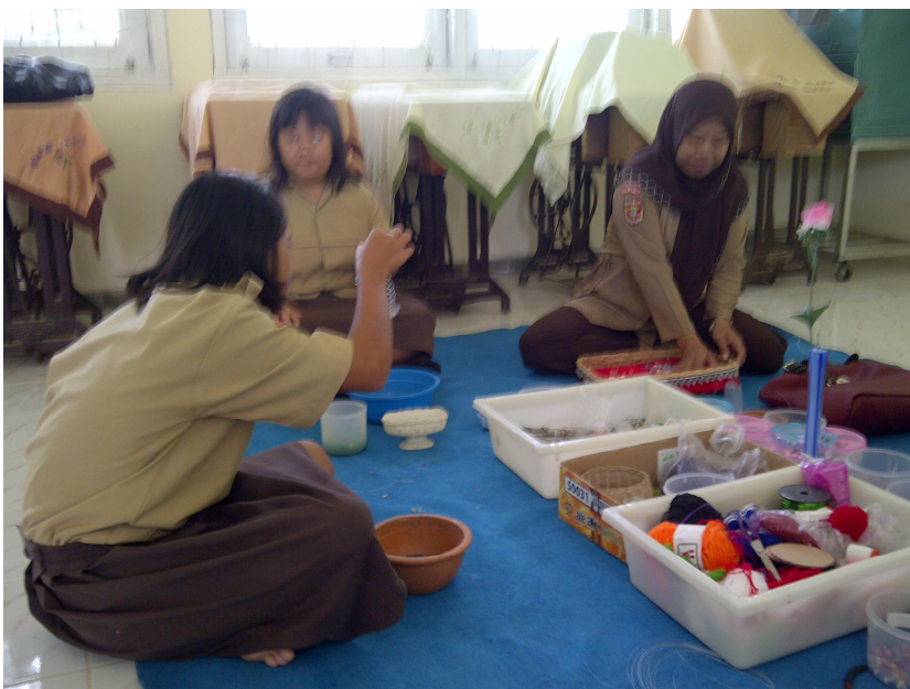
Keterangan: siswi tunagrahitadan guru dalam membuat kerajinan pernak-pernik