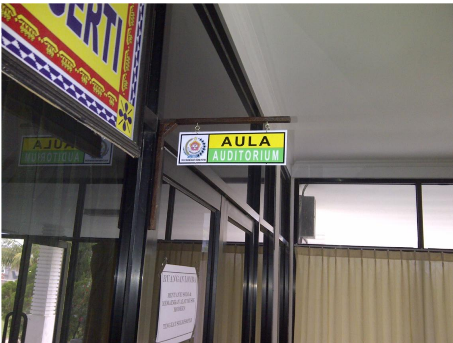
Keterangan: Aula Auditorium