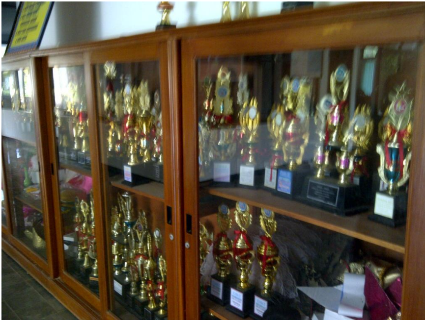
Keterangan: penghargaan prestasi siswa