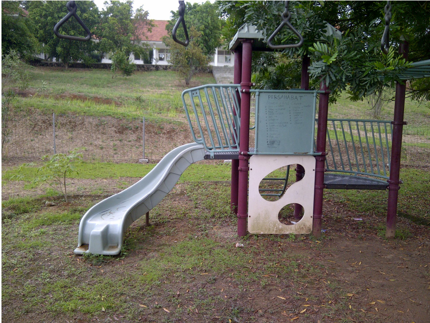
Keterangan: Taman Bermain