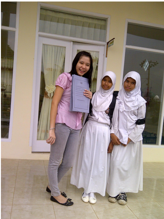
Keterangan: peneliti bersama siswa SLB