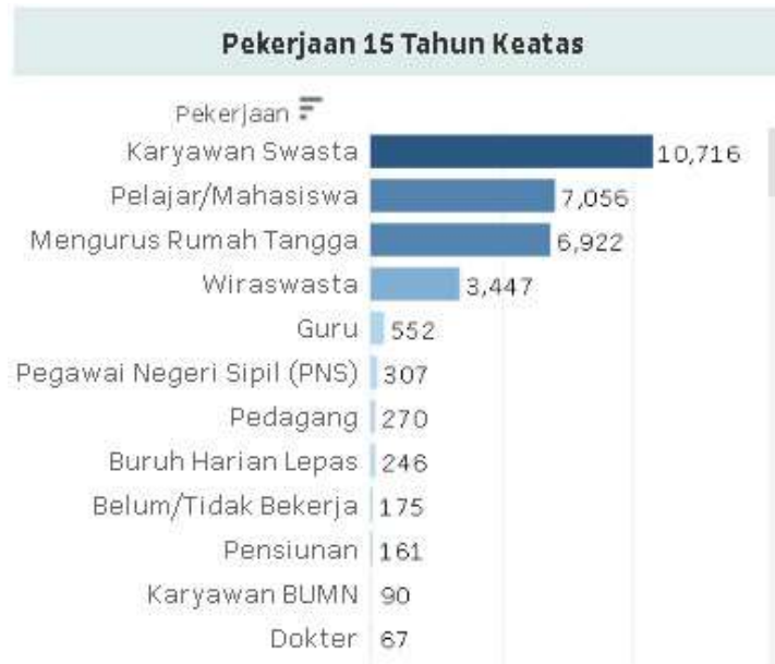
Gambar 2. Data Penduduk Berdasar Profesi