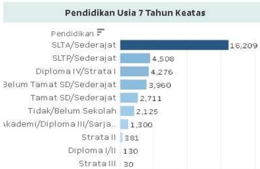
Gambar 4. Data Penduduk Berdasarkan Pendidikan