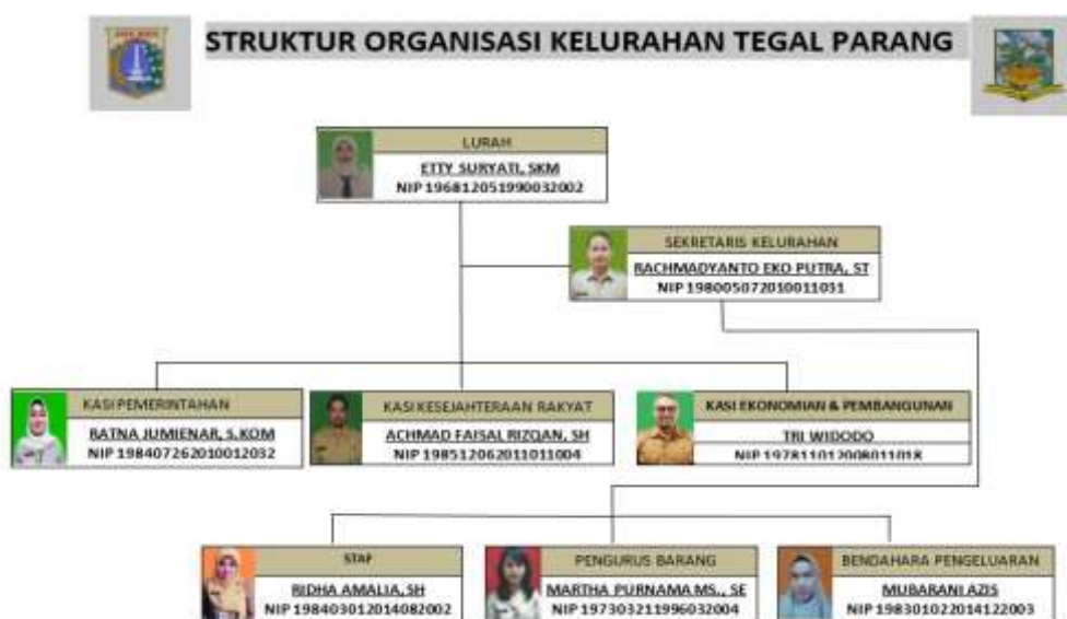
Gambar 5. Struktur Organisasi Kelurahan Tegal Parang