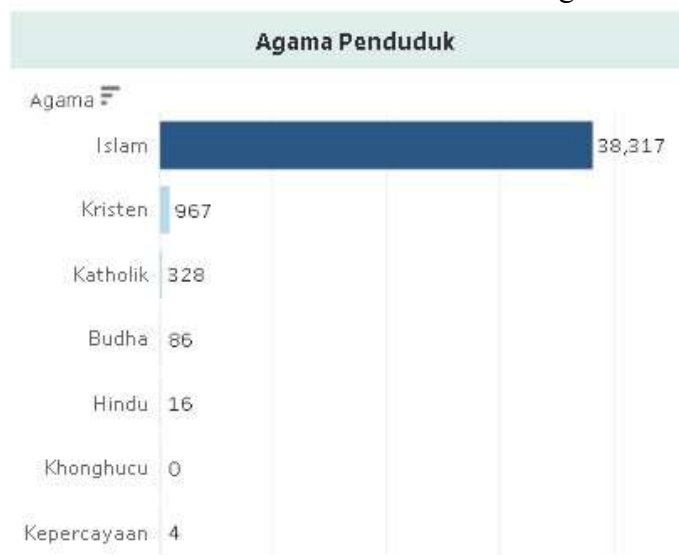
Gambar 3. Data Penduduk Berdasar Agama