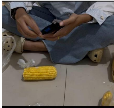
Gambar 11. Pengukuran brix pada jagung manis.