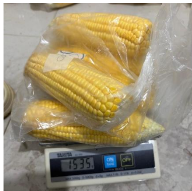
Gambar 12. Pengukuran susut bobot tanpa kelobot.

Menghitung persentase penurunan berat tongkol jagung setelah dipanen, dengan kondisi kelobot (kulit pembungkus) sudah dilepaskan.