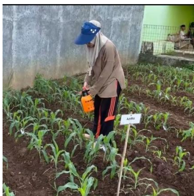
Gambar 5. Pengaplikasian eco enzyme dan poc pada tanaman jagung manis.

Aplikasi eco enzyme dan POC pada tanaman jagung manis dilakukan secara bertahap mulai dari usia 3 Minggu Setelah Tanam (MST) hingga 7 MST. Sebelum diaplikasikan, larutan eco enzyme dan POC terlebih dahulu diencerkan dengan penambahan air bersih untuk mendapatkan konsentrasi yang sesuai dengan kebutuhan tanaman. Proses aplikasi dilakukan melalui metode penyemprotan langsung ke permukaan daun menggunakan alat semprot punggung ( knapsack sprayer ) berkapasitas 5 liter. Waktu pelaksanaan penyemprotan dilakukan pada pagi hari, karena pada saat tersebut stomata daun jagung berada dalam kondisi terbuka sehingga penyerapan larutan oleh jaringan daun menjadi lebih optimal. Selain itu, suhu lingkungan yang masih rendah pada pagi hari dapat meminimalkan risiko penguapan larutan eco enzyme dan POC, sehingga efisiensi penyerapan meningkat.