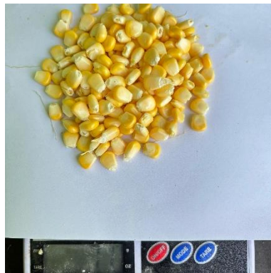
Gambar 9. Bobot segar 200 biji tanaman jagung manis.