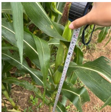
Gambar 7. Tinggi tongkol utama tanaman jagung manis.

Tinggi tongkol utama diukur dari permukaan tanah sampai pada buku tempat tongkol berada saat tongkol pertama kali muncul ( tassel ). Pengukuran tinggi tongkol utama dilakukan pada tanaman umur 3 MST dengan satuan cm, dan dilakukan pada 5 tanaman sampel di tiap petakan.