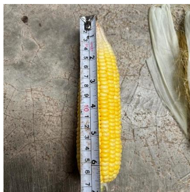
Gambar 10. Panjang tongkol tanaman jagung manis.

Pengambilan 10 tongkol jagung secara acak dari populasi sampel, kemudian diukur panjang setiap tongkolnya dari pangkal hingga ujung, lalu dihitung nilai rata-ratanya.