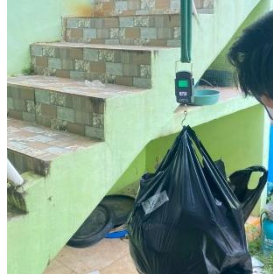
Gambar 13. Produksi per petak tanaman jagung manis.