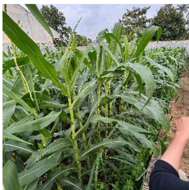
Gambar 8. Bunga jantan jagung manis.

Munculnya tasseling 50% pada tanaman jagung adalah suatu fase pertumbuhan generatif yang ditandai ketika 50% populasi tanaman dalam suatu petak sudah mengeluarkan tassel (bunga jantan) secara penuh. Tassel merupakan bagian bunga jantan yang muncul di ujung batang utama jagung dan menghasilkan serbuk sari (pollen).