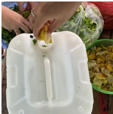
Gambar 3. Proses pembuatan eco enzyme.