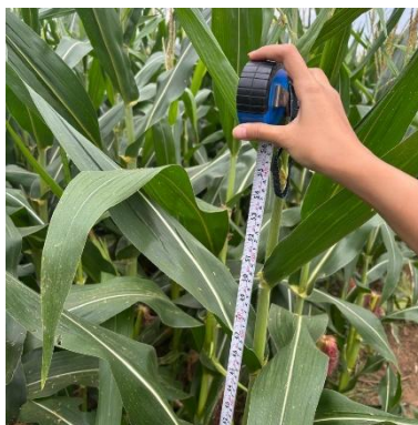
Gambar 6. Pengukuran tinggi tanaman jagung manis.