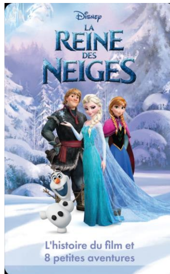
Gambar 1. Poster Film La Reine Des Neiges

Album soundtrack La Reine des Neiges (versi Prancis) dirilis oleh Walt Disney Records pada tahun 2013, terdiri dari 32 lagu dalam edisi standar dan 59 lagu dalam edisi deluxe , yang mencakup demo, versi karaoke, dan lagu yang tidak digunakan seperti Life's Too Short . Partitur orkestra dikomposisikan oleh Christophe Beck, yang mengambil inspirasi dari musik Sámi untuk menciptakan nuansa Nordik, termasuk lagu pembuka Vuelie oleh Frode Fjellheim. Lagu-lagu utama ditulis oleh Kristen Anderson- Lopez dan Robert Lopez, yang merancang lirik untuk mendukung narasi emosional film.