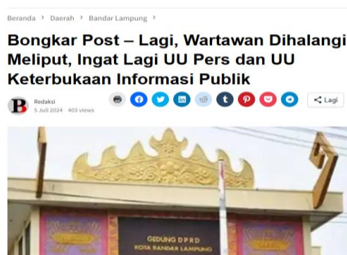
Gambar 2. Pemberitaan Liputan Media

dalam pemberitaan yang memuat peristiwa pembatasan wartawan dalam meliput, sebagai berikut: