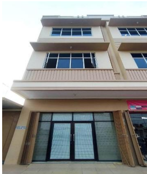
Gambar 3.1 Lokasi PT. AKJ Medika Indonesia