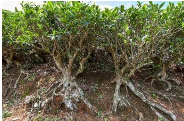
Gambar 1. Gambar Morfologi Tanaman Teh

Karakter morfologis yang berhubungan erat dengan kandungan katekin meliputi kepadatan stomata dan sudut daun. Pemilihan secara tidak langsung untuk kandungan katekin dapat melibatkan kepadatan stomata, diiringi dengan memperhatikan ciri morfologis lain yang dapat mempengaruhi kandungan katekin secara tidak langsung. Ciri sudut daun juga dapat digunakan sebagai alat indikator dalam seleksi tidak langsung untuk mengetahui kandungan katekin. Morfologi tanaman teh ( Camellia sinensis ) ditandai oleh sistem perakaran yang kuat serta struktur batang dan percabangan yang mendukung penyerapan hara dan pertumbuhan pucuk Gambar 1.