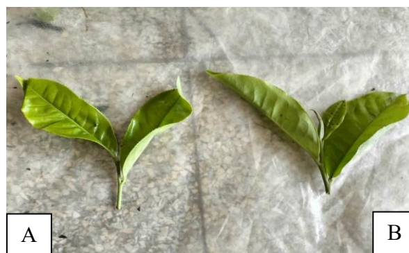
Gambar 2. Pucuk Daun Teh

Selain itu, komponen kualitas yang berbeda, seperti senyawa yang bisa menguap maupun yang tidak, terakumulasi dengan cara yang berbeda dalam pucuk teh serta berkontribusi pada kualitas akhir dari produk teh tersebut. Berbagai faktor yang ada pada tanaman, mulai dari bagaimana stres dirasakan hingga cara metabolit disintesis, memainkan peranan penting dalam proses ini, termasuk sinyal penerima, faktor pengatur sinyal, faktor transkripsi (TFs), dan gen-gen sintesis lainnya. Proses akumulasi komponen berkualitas dalam jalur-jalur ini sangat tergantung pada kondisi stres yang dialami, yang dapat meningkatkan atau mengurangi mutu teh yang dihasilkan. Namun, walaupun sudah banyak penelitian tentang hubungan antara stres lingkungan dan kualitas teh, ulasan yang merangkum semua penelitian tersebut sangat sedikit. Pertama, cara stres ini berdampak pada komponen penentu kualitas dalam pucuk teh masih belum jelas sepenuhnya. Kedua, pengaruh stres terhadap kualitas akhir dalam aspek sensorik dan nutrisi juga masih belum dipahami dengan baik, dan terakhir, metode untuk mengatasi stres tanpa mengorbankan pertumbuhan tanaman dan kualitas belum sepenuhnya dirumuskan (Liu et al. , 2022).