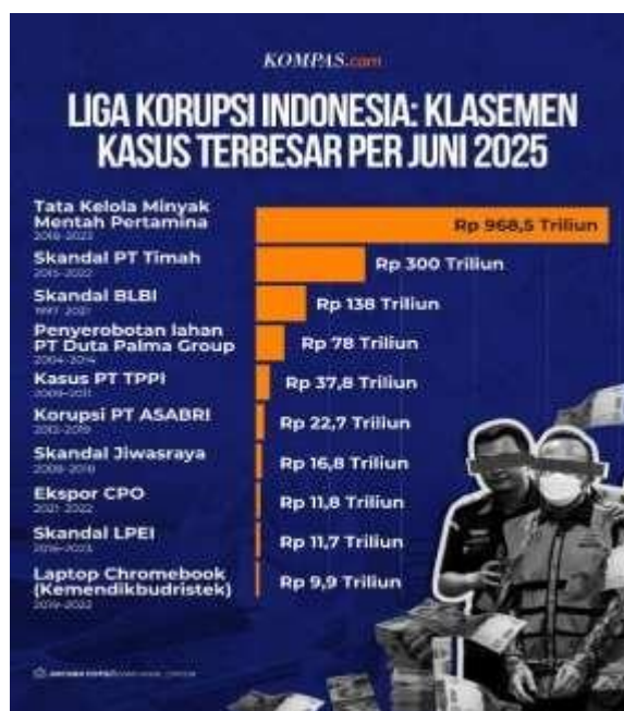
Gambar 1.1 Liga Korupsi Indonesia