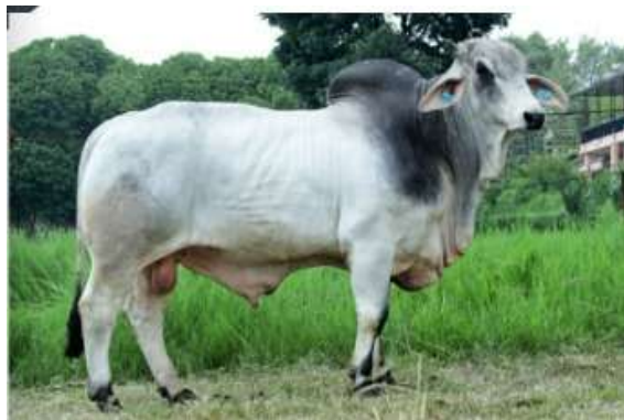
Gambar 1. Sapi Brahman

Sapi Brahman berasal dari India dan termasuk dalam kelompok sapi Zebu. Pada tahun 1854, sapi ini mulai dibawa ke Amerika Serikat dan dikembangkan pertama kali di daerah Louisiana. Selanjutnya, perkembangannya meluas ke beberapa wilayah lain di Amerika Serikat dan kemudian menyebar ke berbagai daerah beriklim tropis maupun subtropis, termasuk Australia (Siregar, 2013). Sapi brahman dapat dilihat pada Gambar 1 berikut ini.