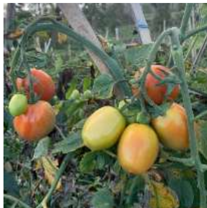
Gambar 2. Buah tomat ( Solanum lycopersicum )

Tomat merupakan salah satu komoditas sayuran yang memiliki tingkat produksi tinggi serta dapat dikonsumsi baik dalam bentuk segar maupun setelah melalui proses pengolahan. Dalam sektor industri, tomat dimanfaatkan sebagai bahan baku berbagai produk, seperti tomat kalengan, jus tomat, pasta tomat, bumbu pada daging maupun ikan kalengan, serta beragam olahan lainnya. Selain itu, tomat digolongkan sebagai sayuran buah yang populer karena memiliki cita rasa yang segar dengan sedikit rasa asam, serta menjadi sumber penting vitamin A dan vitamin C (Husen et al. , 2021). Buah tomat dapat dilihat pada Gambar 2 dibawah ini.