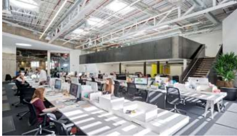
Gambar 2.1 Tata Ruang Terbuka