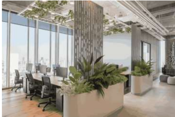
Gambar 2.3 Tata Ruang Semi Terbuka dan Tertutup

luas dan akses komunikasi masih sangat mudah.