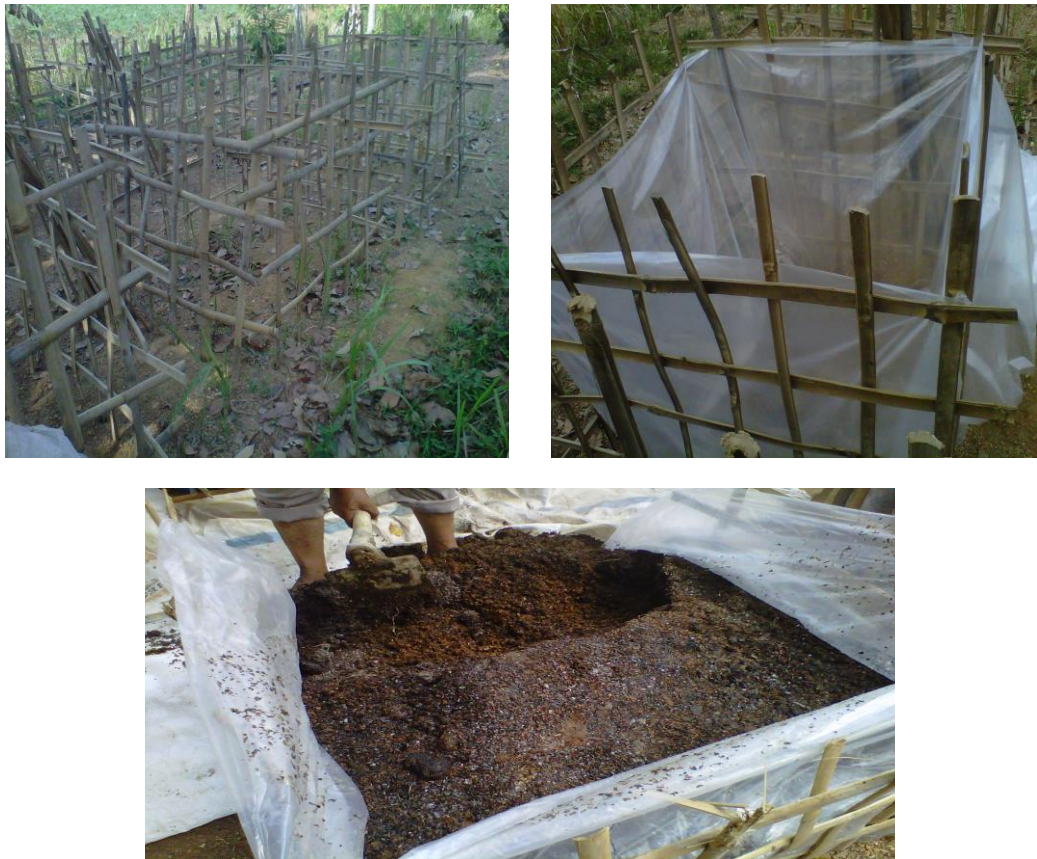
Gambar 7. Desain wadah pengomposan dengan tumpukan awal 1x1x1 m