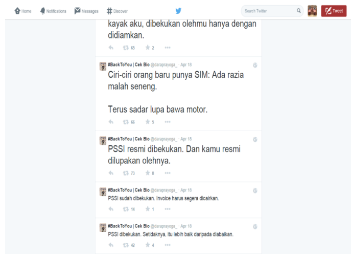
Gambar 4.4 Contoh Tweet Dara Prayoga

Namun tweet tersebut tidak dalam konteks yang serius, seperti contoh sebagai berikut: