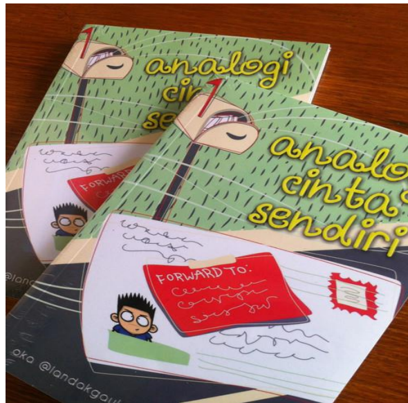
Gambar 4.2 Novel Analogi Cinta Sendiri

Buku Analogi Cinta Sendiri dalam beberapa hari setelah terbit berhasil masuk rak “buku laris” di Gramedia Depok. Kemudian masuk dalam kategori “best seller” juga di beberapa gramedia lain, seperti di Gramedia Lampung, di Ambarukmo Plaza Yogyakarta, di Gramedia Gajah Mada Medan serta masuk peringkat 3 “ top ten books ” di Gramedia Yogyakarta.