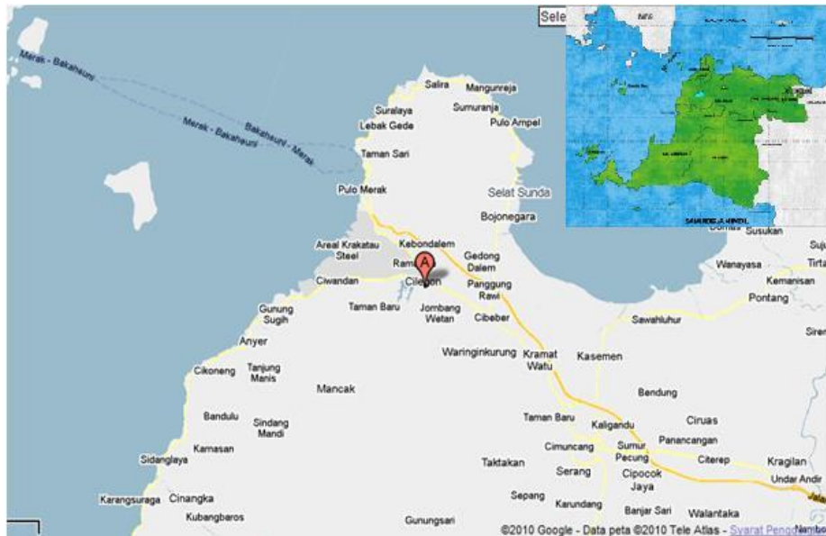
Gambar 1.2. Peta Kota Cilegon.

Pertimbangan pemilihan Cilegon sebagai lokasi pendirian Pabrik Alil