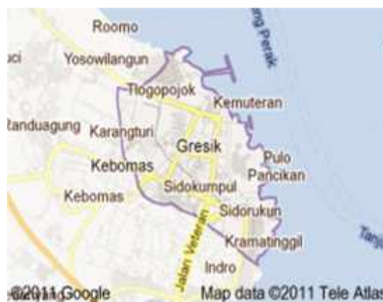
Gambar 1.3 Peta Gresik

Gresik merupakan daerah dengan jumlah penduduk yang relatif banyak, tetapi sebagai kawasan industri perluasan pemukiman penduduk dibatasi agar upaya perluasan pabrik dapat berjalan dengan lancar. Peruntukan kawasan industri masih relatif luas \pm 500 ha ( Sumber: x.kemenperin.go.id/IND/Link/KIP.pdf. Tanggal: 15 Agustus 2012 ).