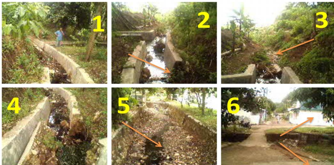
Gambar 5 Kondisi Drainase Sungai di Kelurahan Keteguhan Bakung Teluk Betung Barat Bandar Lampung.

Keterangan : 1. Drainase yang dialiri air sungai kecil dan Air Leachate Dari IPAL TPA Bakung, 2, 3. Drainase yang menuju Lingkungan Perum. Keteguhan tidak kedap 4. Kondisi Drainasi rusak , 5. Dasar Drainase tidak kedap dan tidak terawat dilingkungan Kel. Keteguhan, 6. Jarak Drainase Yang membelah/melewati Perum. Keteguhan sebelah utara dan selatan