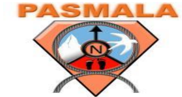
Gambar 2: Lambang Organisasi Pasmala