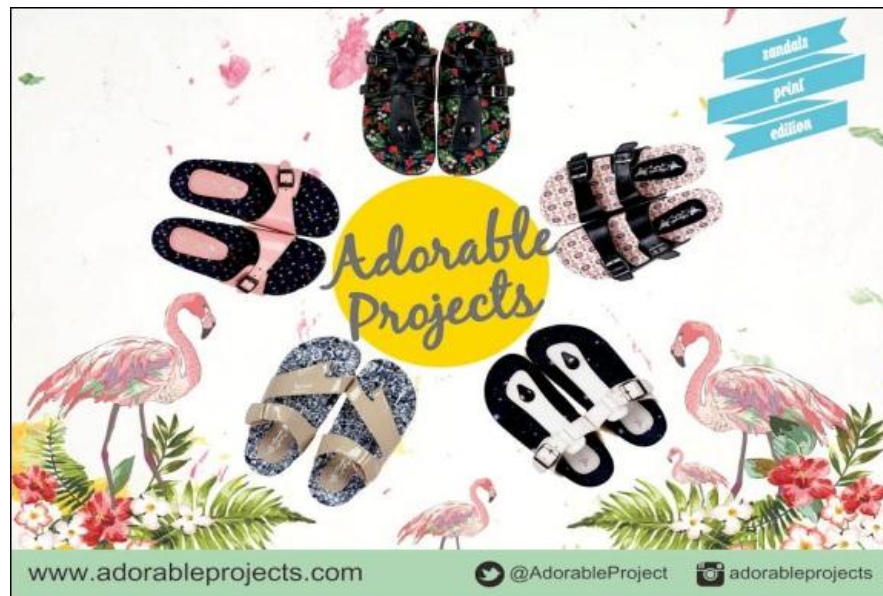
Gambar 4.1 Profil Facebook Adorable Project Indonesia