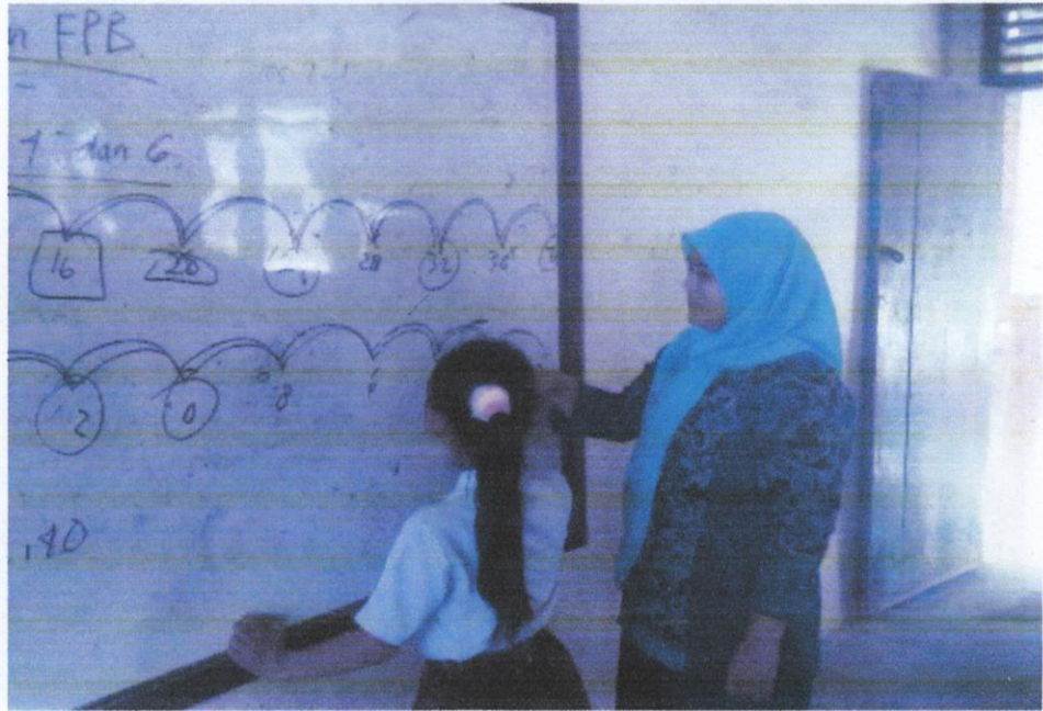
Gambar 1. Guru sedang memerikan penjelasan kepada salah satu murid