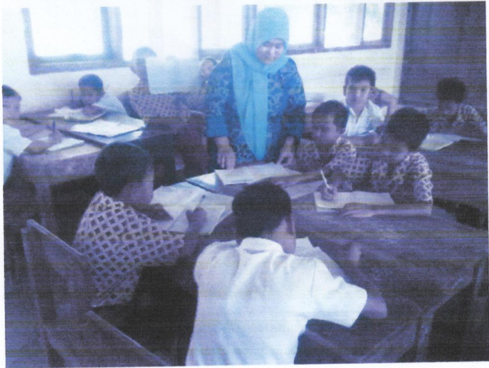
Gambar 5. Guru sedang memberikan penjelasan kepada kelompok