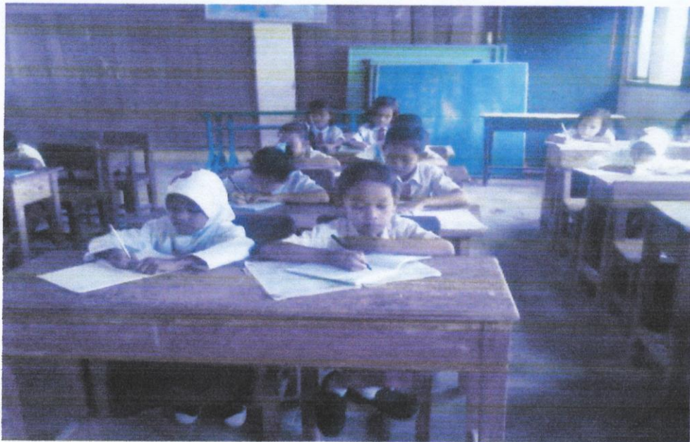
Gambar 4. Siswa sedang mencatat materi pelajaran