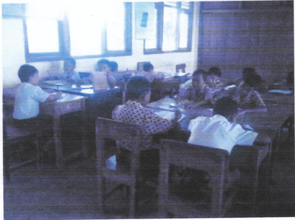
Gambar 9. Siswa sedang mengerjakan tugas kelompok