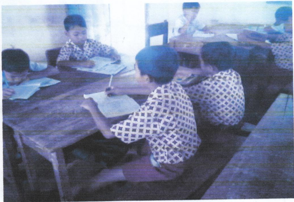
Gambar 6. Siswa sedang mengerjakan tugas kelompok