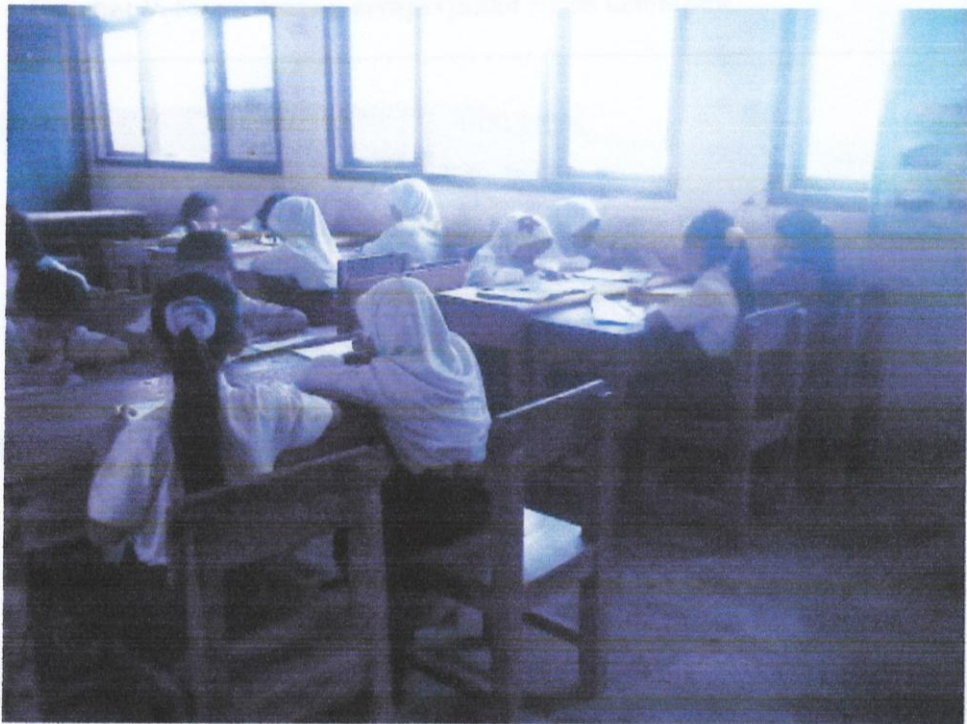
Gambar 8. Siswa sedang mengerjakan tugas kelompok