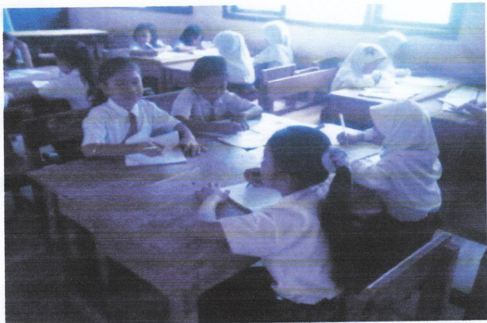
Gambar 10. Siswa sedang mengerjakan tugas kelompok