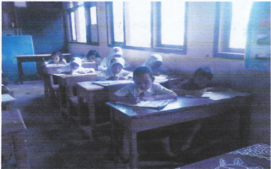
Gambar 2. Murid sedang mencatat materi yang diajarkan