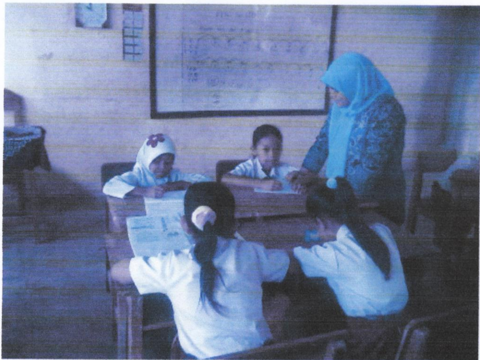
Gambar 3. Guru sedang memberikan penjelasan kepada kelompok