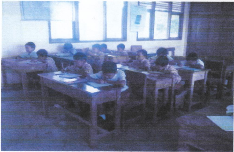
Gambar 7. Siswa sedang mencatat hasil kerja kelompok