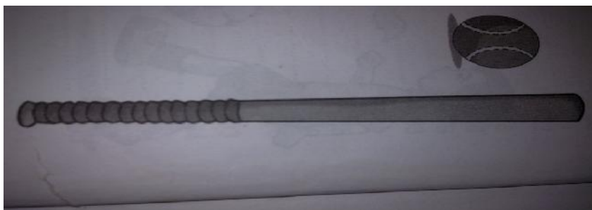
Gambar 2. pemukul dan bola kasti