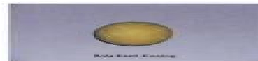
Gambar 3. Bola Kasti