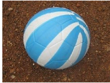
Gambar 2. Alat modifikasi dengan bola plastik dan bola karet.

Dalam penelitian ini, peneliti menggunakan bola plastik dan bambu rintangan.