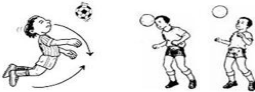
Gambar 4. Menyundul bola