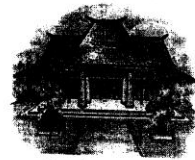
Rumah Jawa Barat