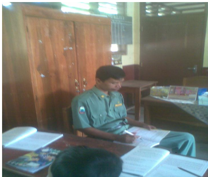
Foto-foto Proses Pembelajaran