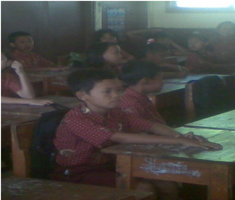
Foto-foto Proses Pembelajaran