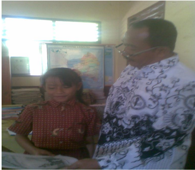
Kinerja Siswa Menjawab pada Kegiatan Siklus II