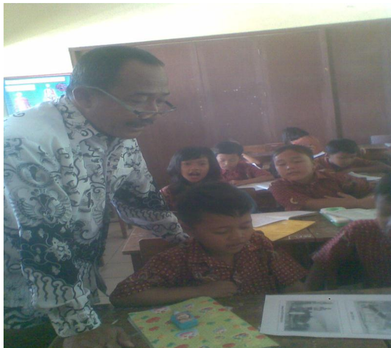
Kegiatan Belajar Siklus II