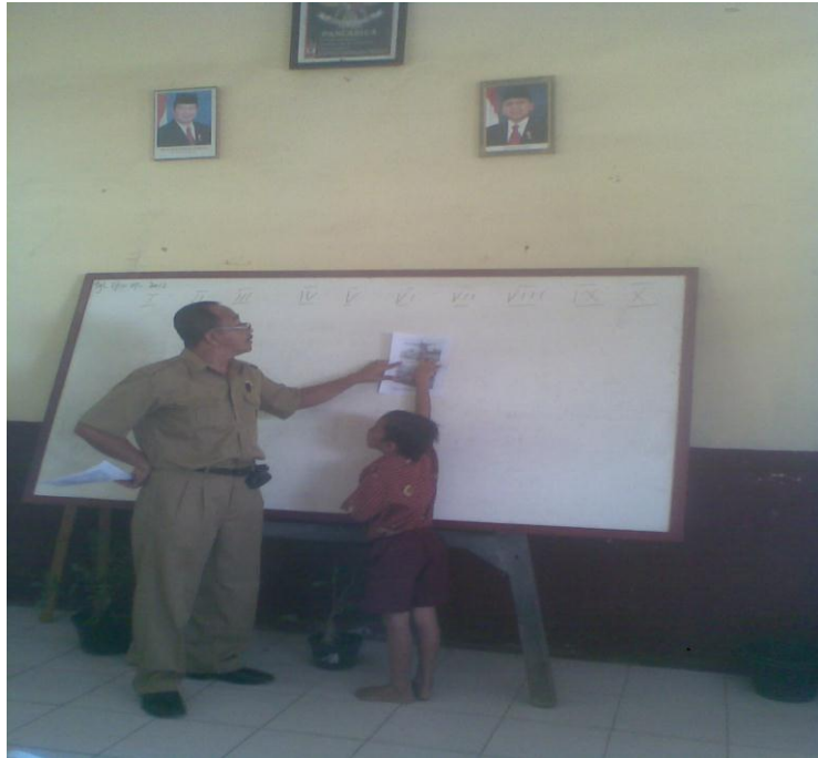
Foto-foto Proses Pembelajaran