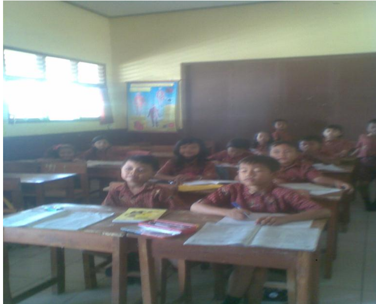
Foto-foto Proses Pembelajaran