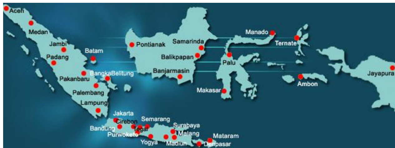
Gambar 2. Sebaran Stasiun Transmisi Trans Tv