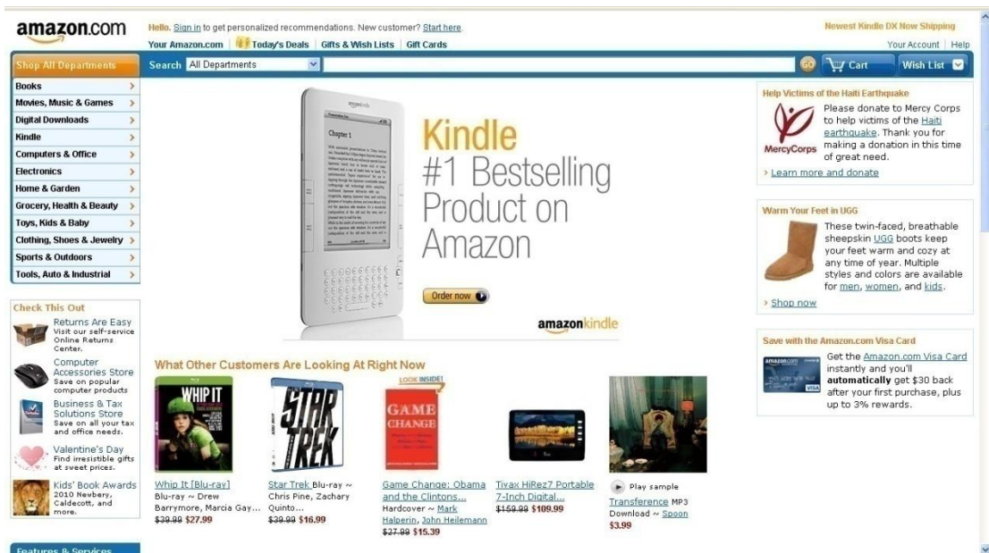
Gambar 1. Menu utama www.amazon.com