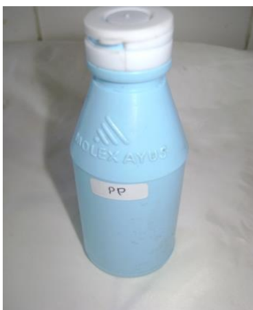
Gambar 7. Indikator PP