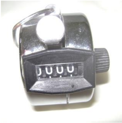
Gambar 3. Hand counter