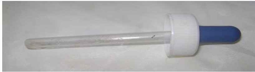
Gambar 8. Pipet tetes