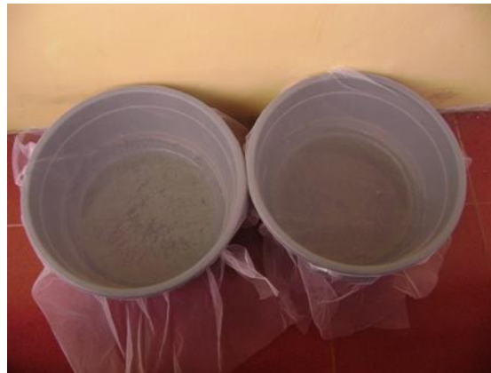
Gambar 10. Baskom