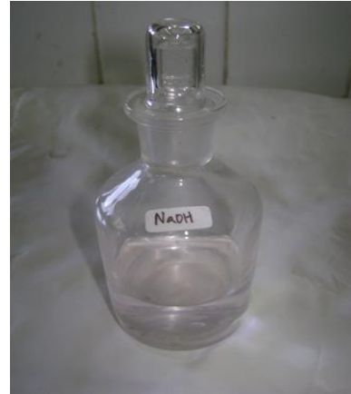
Gambar 4. NaOH 0,02