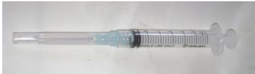
Gambar 9. Terumo