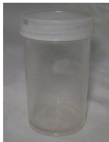
Gambar 8. Botol film