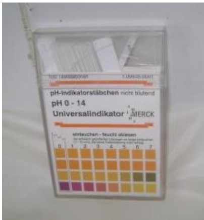
Gambar 5. Indikator pH stick