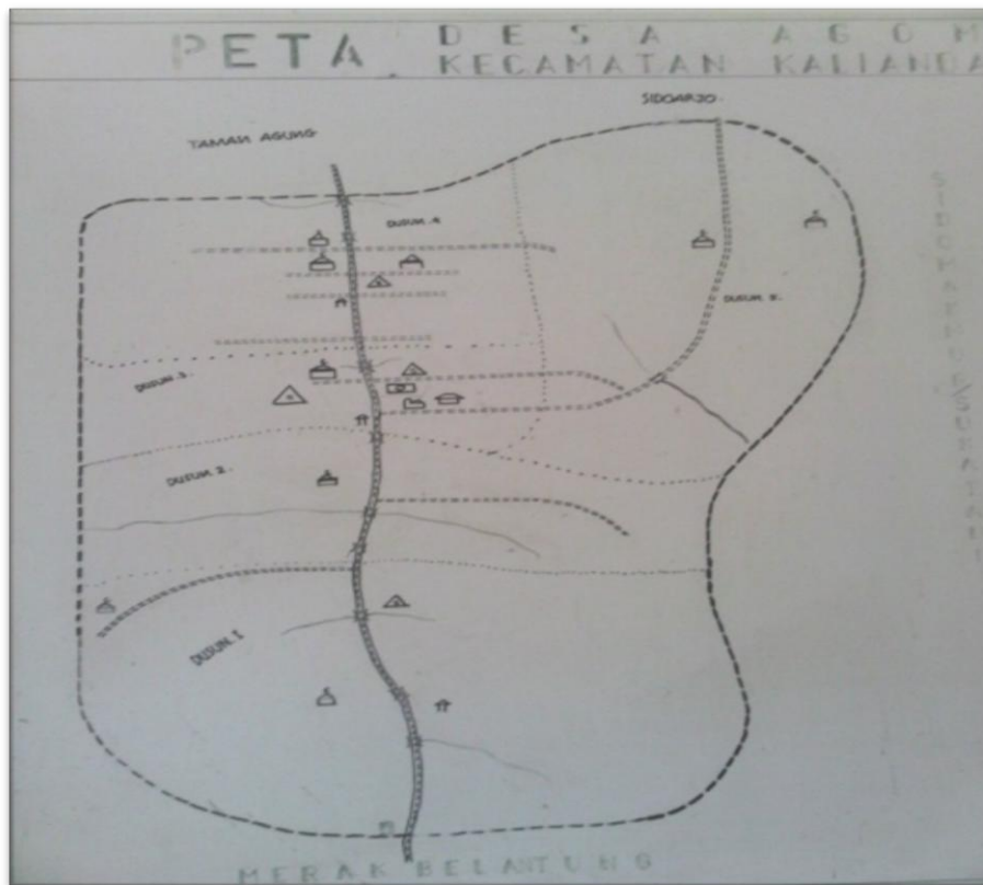
Gambar 3. Peta Desa Agom