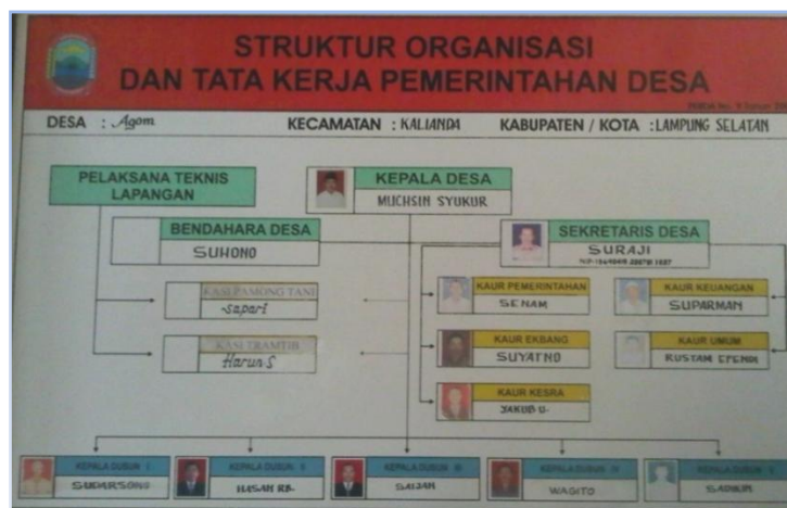
Gambar 4. Struktur kepengurusan pemerintahan desa Agom