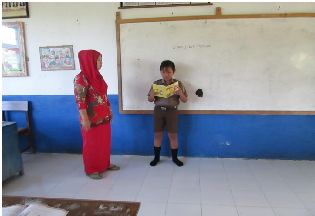
Perwakilan dari kelompok mempersentasikan hasil diskusi