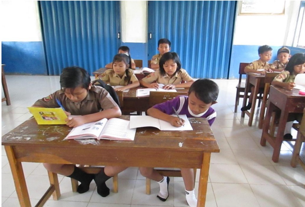
Siswa mengerjakan tugas yang diberikan guru