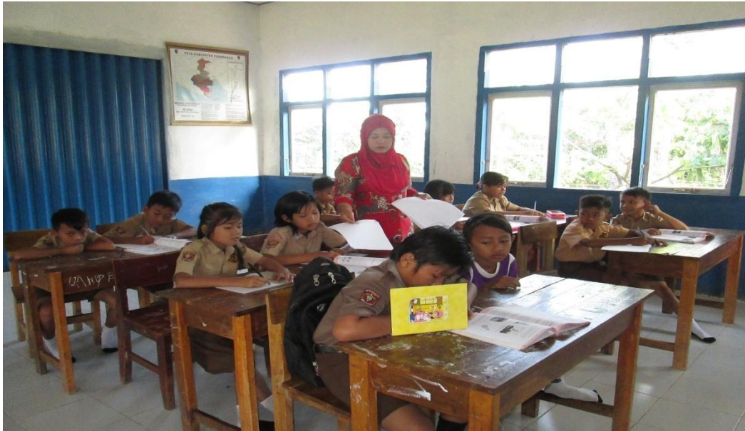
Guru membagikan lembar evaluasi