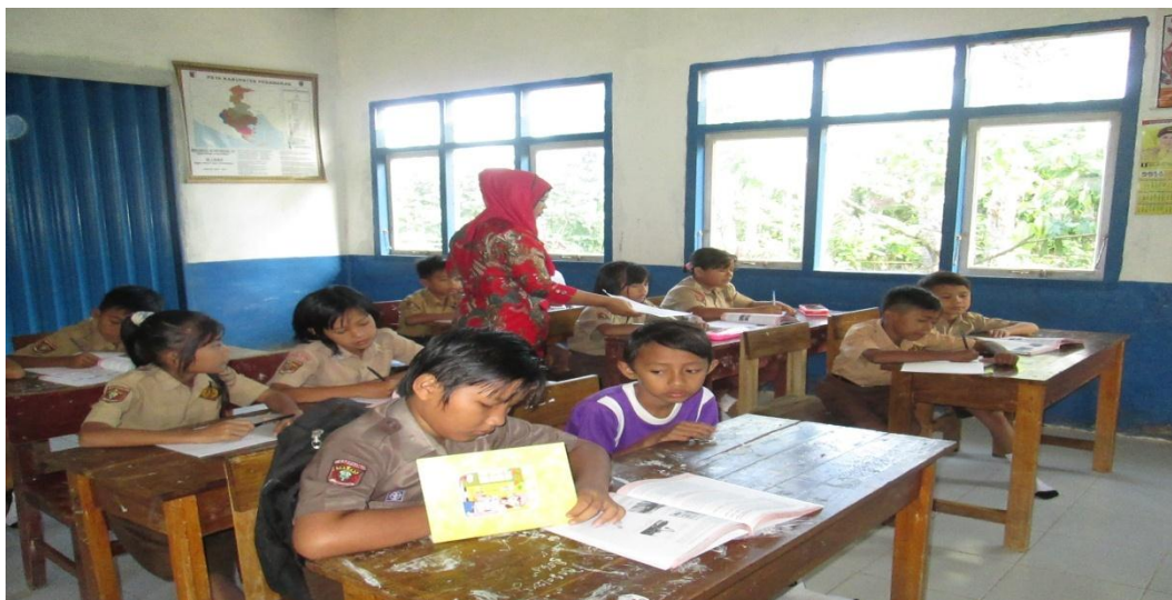
Siswa secara mandiri mengerjakan tugas yang diberikan guru