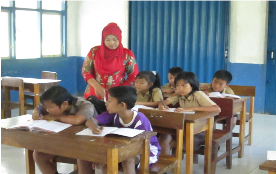
Guru membimbing siswa berdiskusi