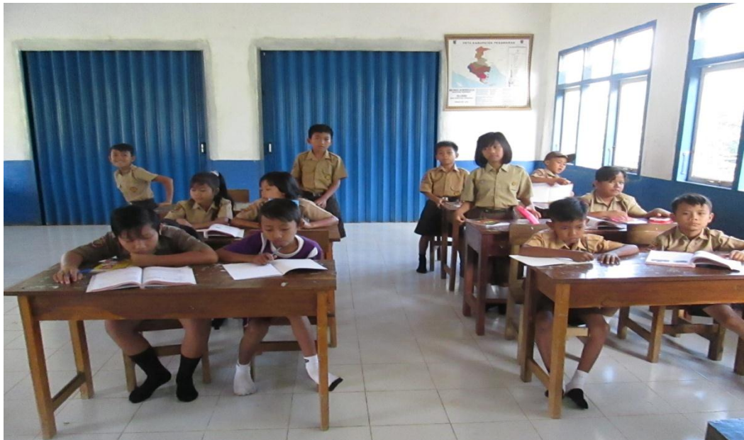
Pembagian kelompok diskusi