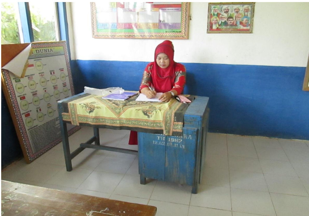
Guru mengoreksi lembar kerja siswa