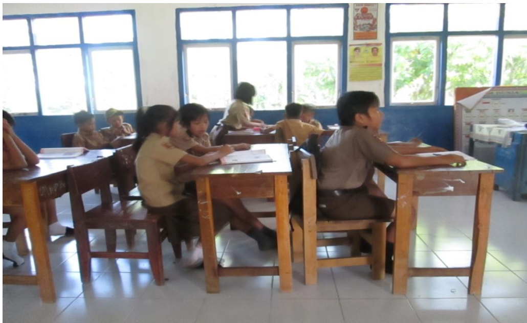
Siswa memperhatikan penjelasan guru