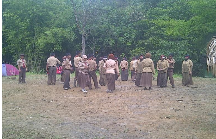
Gambar 5. Kegiatan perkemahan SMKN 1 Liwa.