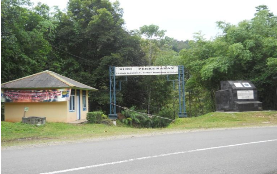
Gambar 1. Pintu masuk obyek wisata alam Resort Balik Bukit.