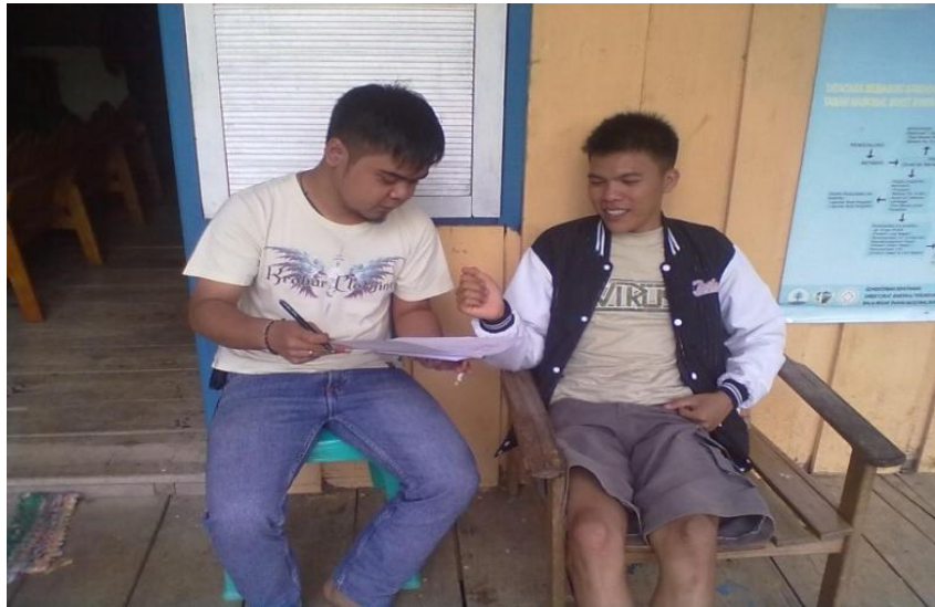
Gambar 3. Wawancara dengan pengunjung nusantara.