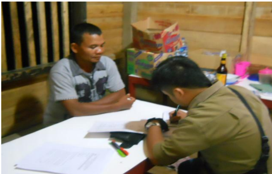
Gambar 2. Wawancara dengan masyarakat.