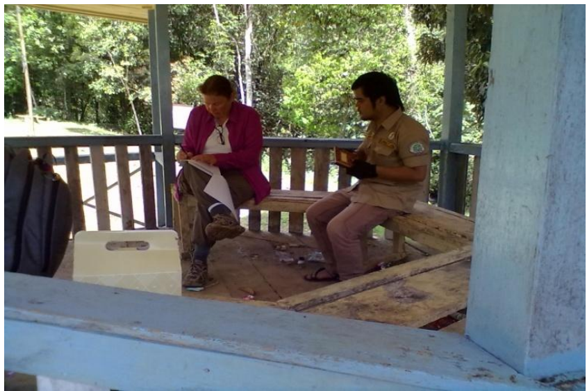
Gambar 4. Wawancara dengan pengunjung mancanegara.