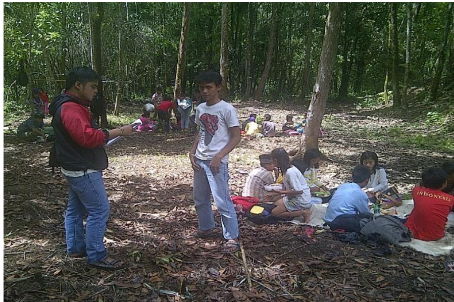
Gambar 6. Kegiatan tadabur alam.