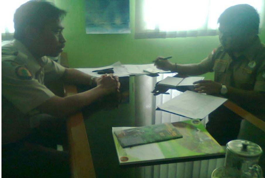
Gambar 7. Wawancara dengan Kepala BPTN II Wil Liwa.