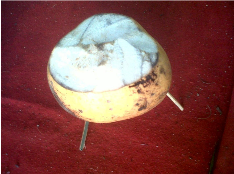
Gambar 18. Kembar Mayang Pengantin Laki-Laki

Keterangan : Kembar Mayang Pengantin Laki-Laki yang baru dirangkai.