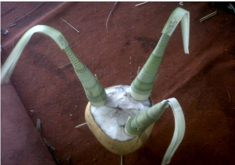
Gambar 19. Kembar Mayang Pengantin Laki-Laki

Keterangan : Kembar Mayang Pengantin Laki-Laki yang sudah jadi.