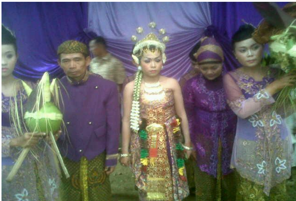
Gambar 23. Proses Upacara Panggih yang menyertakan Kembar Mayang .

Keterangan : Jalannya Upacara Temu Pengantin Jawa yang menyertakan Kembar Mayang . (Pengantin perempuan)