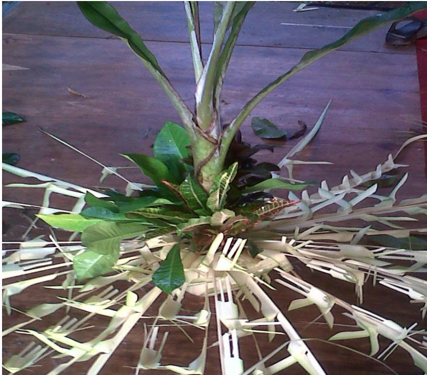
Gambar 16. Kembar Mayang Pengantin Perempuan

Keterangan : Kembar Mayang pengantin perempuan yang baru dirangkai.