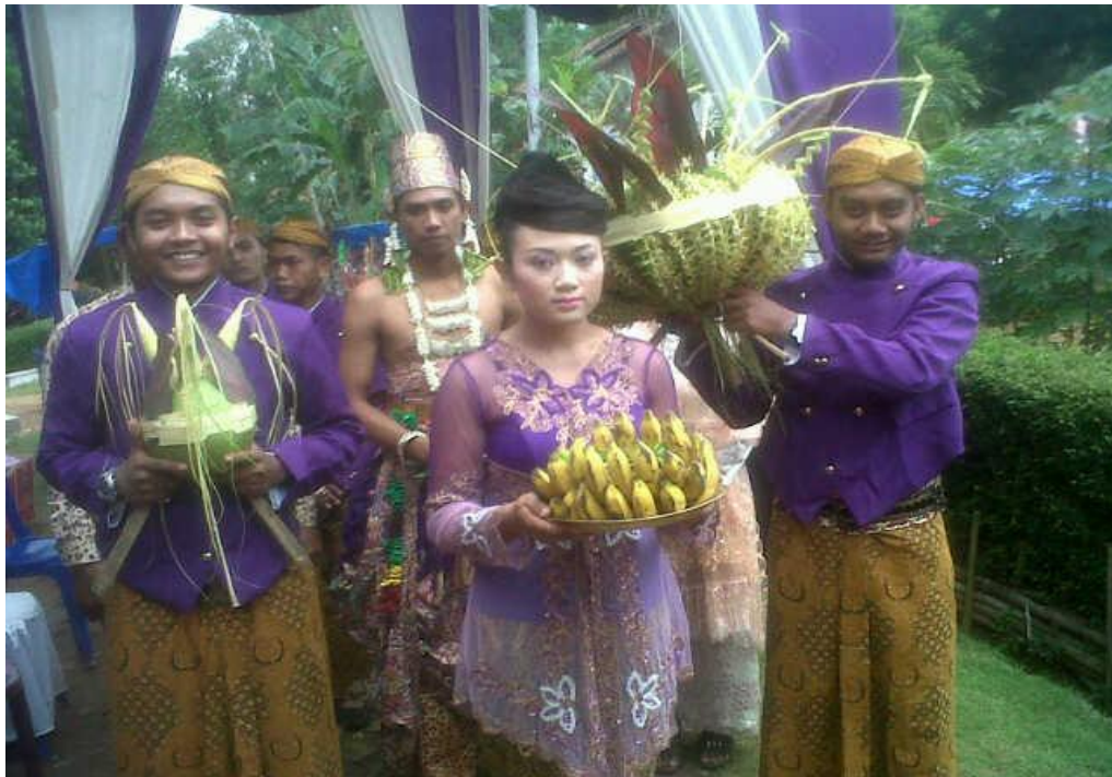
Gambar 22. Proses Upacara Panggih yang menyertakan Kembar Mayang .

Keterangan : Jalannya Upacara Temu Pengantin Jawa yang menyertakan Kembar Mayang . (Pengantin laki-laki)