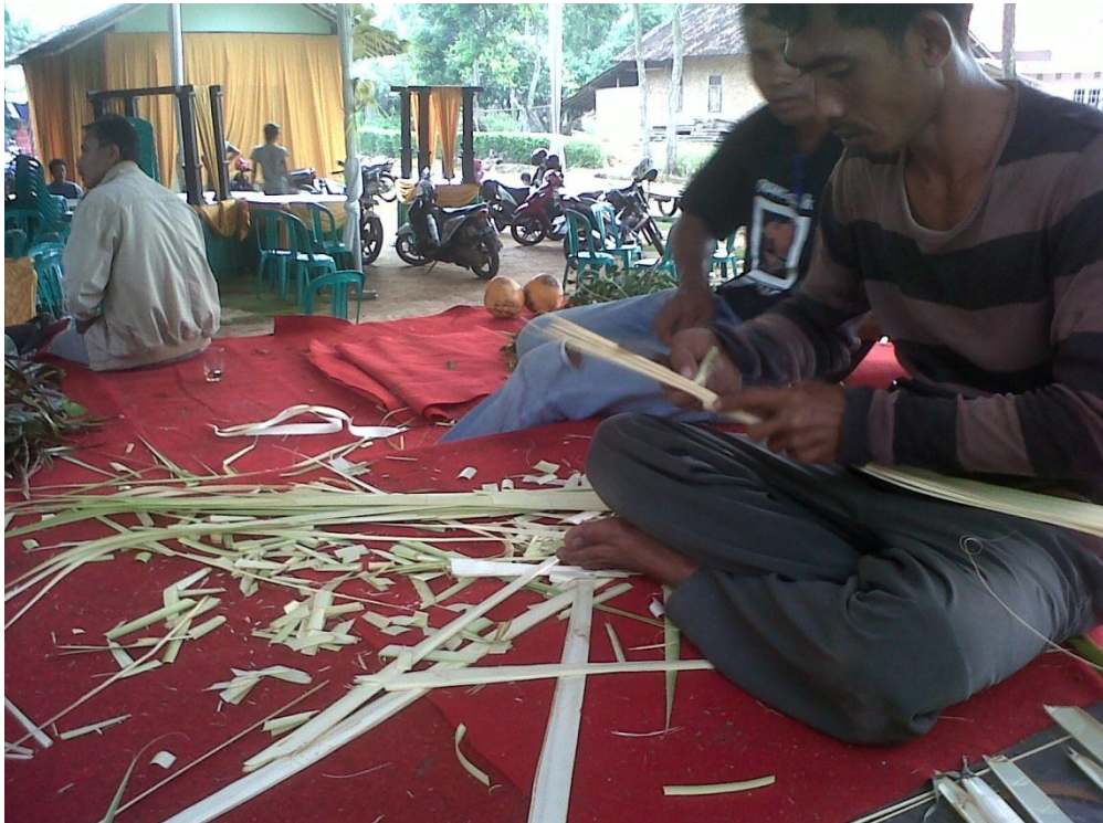
Gambar 20. Proses Pembuatan Kembar Mayang

Keterangan : proses pembuatan motif anyaman dari janur