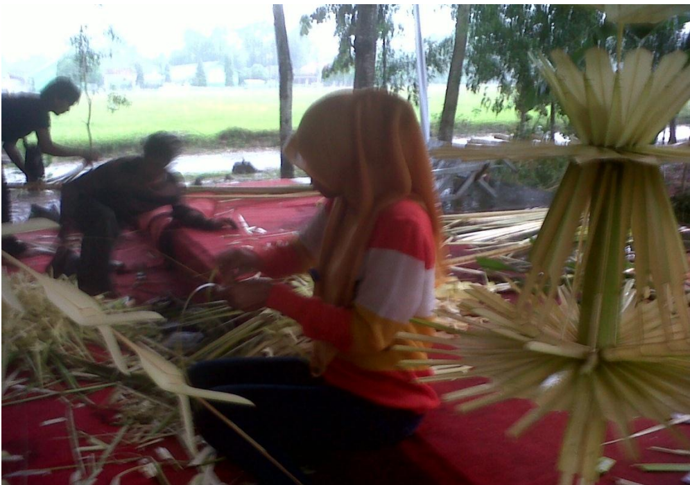
Gambar 21. Proses Pembuatan Kembar Mayang .

Keterangan : proses pembuatan motif anyaman dari janur.