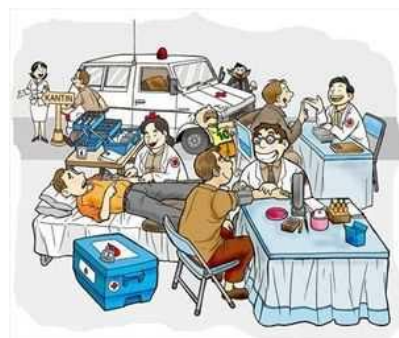
Kegiatan Donor Darah