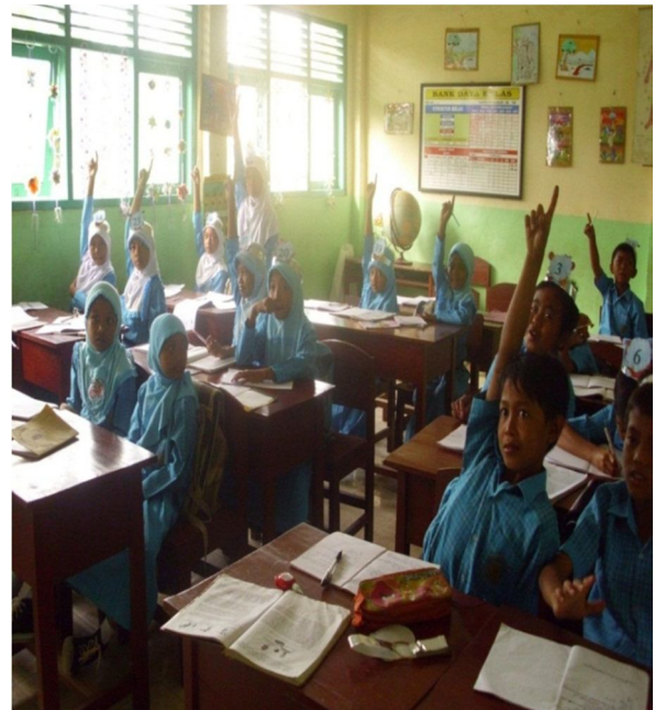
Siswa aktif menjawab dan mengajukan pertanyaan