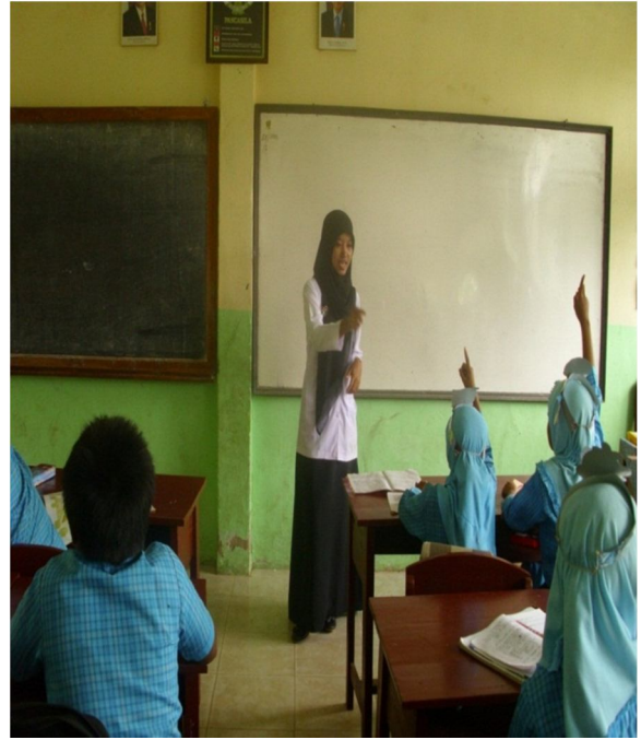
Guru bersama siswa menyimpulkan materi yang telah dipelajari