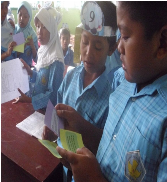
Siswa mencari pasangan kartu