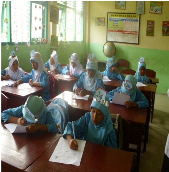
Siswa mengerjakan soal tes formatif