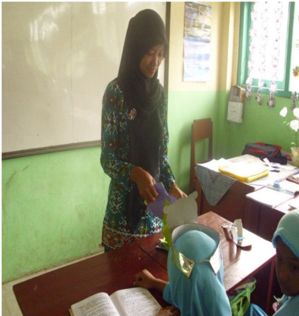
Guru mencampur kartu soal dan kartu jawaban sampai