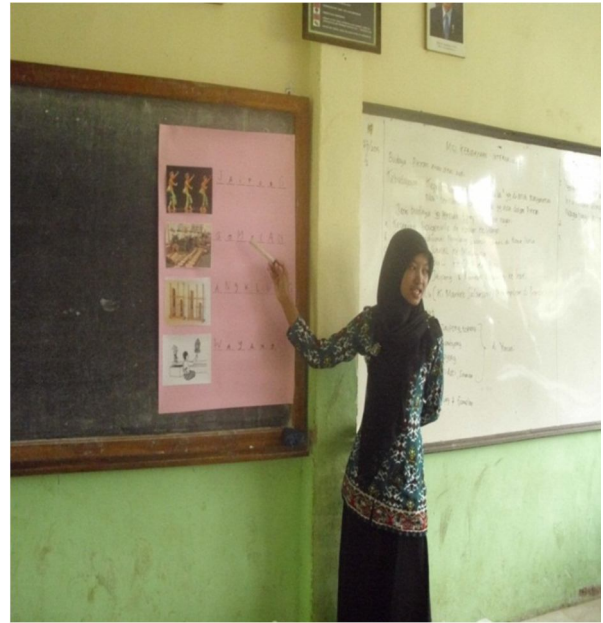
Guru menjelaskan materi dengan bantuan media gambar