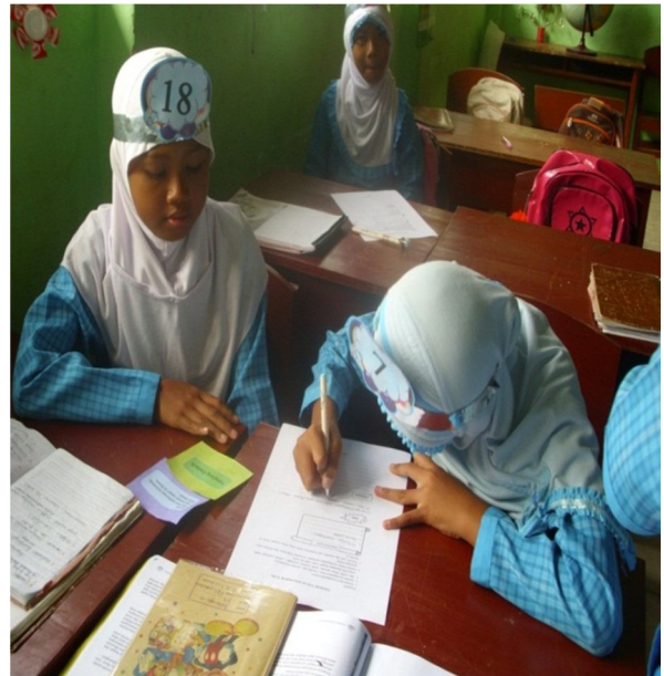
Siswa mencatat hasil pencocokkan kartu ke dalam LTK