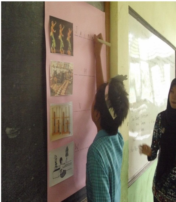
Guru melibatkan siswa dalam pemanfaatan media gambar