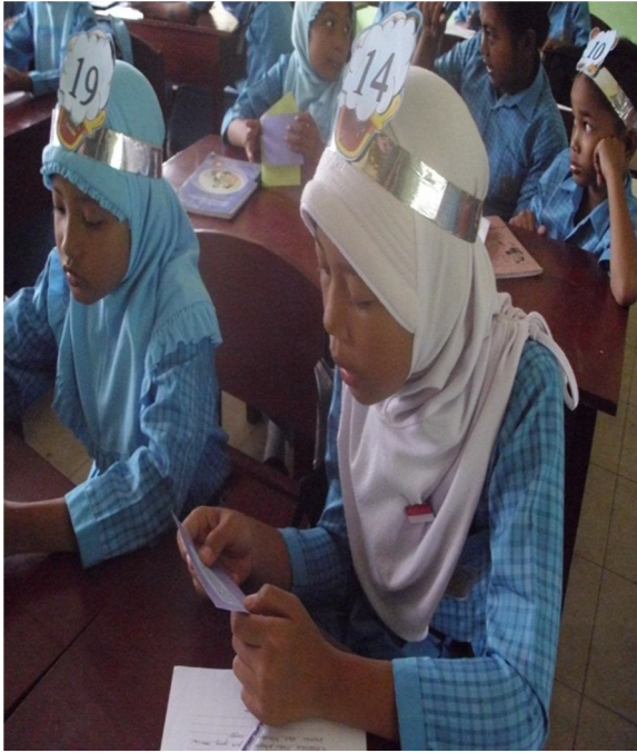
Setiap pasangan membacakan kartu soal dengan keras dan siswa lain menjawab atau menanggapi