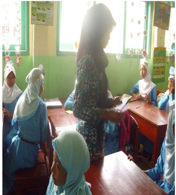
Guru membagikan kartu kepada setiap siswa