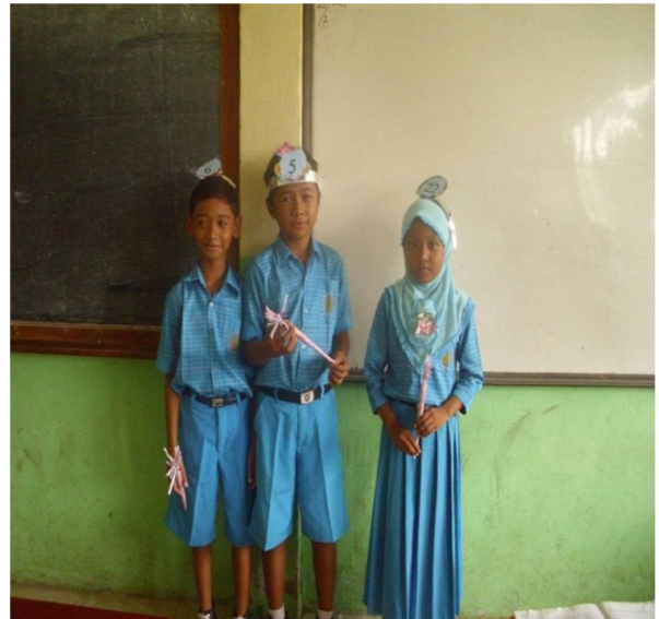
Guru memberikan hadiah kepada siswa yang aktif dan antusias dalam proses pembelajaran