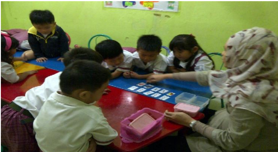
Gambar 4. Guru sedang menjelaskan pemanfaatan alat peraga Montessori ( Pink box 4 ) kepada anak-anak.