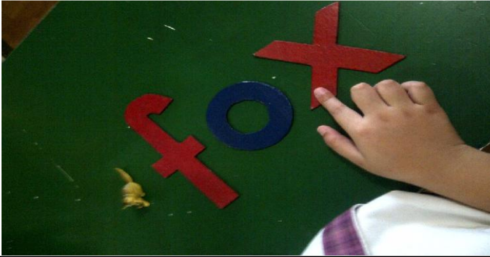
Gambar 3. Anak sedang menyusun kata dengan memanfaatkan alat peraga Montessori ( pink box 1 dan LMA)