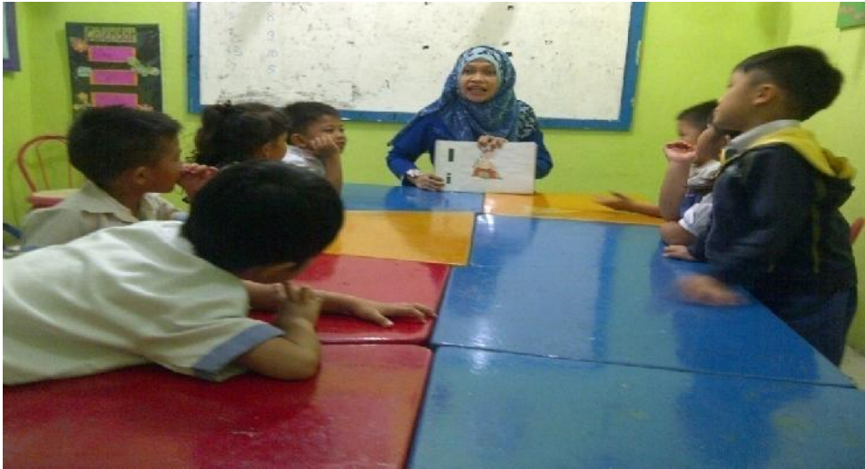
Gambar 1. Guru sedang memberikan apersepsi kepada anak tentang bunyi suara ( phonetic sound ).