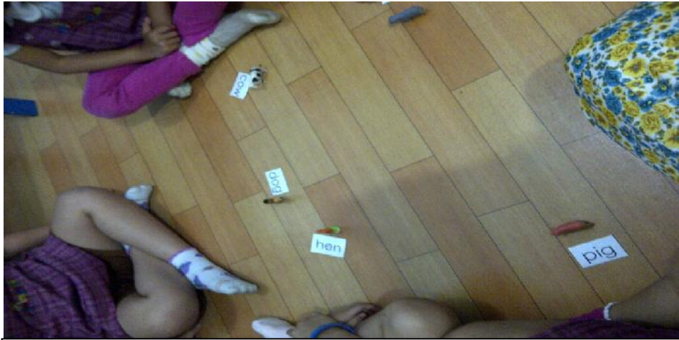
Gambar 5. Anak sedang mencari kata yang sesuai dengan miniatur yang dipilihnya. Kegiatan ini dilaksanakan pada pertemuan kedua di siklus II.