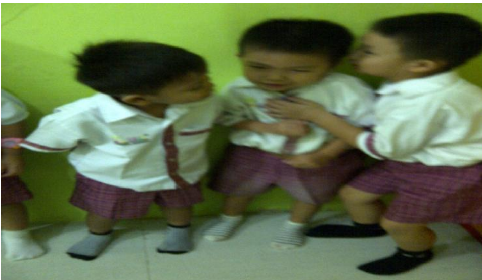
Gambar 2. Anak sedang membisikan salah satu nama hewan buas yang dilakukan secara berantai.