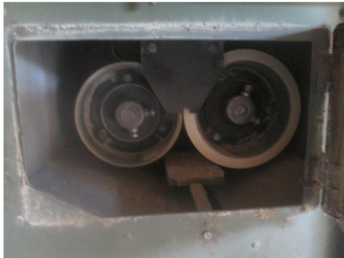
Gambar 1. Rol karet pada mesin pecah kulit

udara perlu di dalam ruang pengupasan gabah agar dapat membantu mendinginkan rol karet. Aliran angin yang disalurkan ke bagian ini juga dapat berfungsi menyebarkan gabah yang turun dari bak penampungan serta beras pecah kulit dan sekam yang jatuh dari sela-sela rol karet.