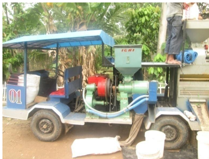
Gambar 2. Penggilingan padi berjalan

penggilingan padi seperti pada Gambar 2. Fungsi dari penggilingan padi berjalan sama seperti penggilingan padi menetap yaitu mengubah gabah menjadi beras. Perbedaan dari kedua penggilingan ini yaitu pada proses pengolahannya penggilingan padi berjalan dapat dibawa berkeliling ke tempat petani langsung dalam mengolah gabah yang mereka giling, dan langsung mengolahnya di tempat petani tersebut. Sedangkan penggilingan padi menetap, padi yang akan digiling harus melalui proses pengangkutan gabah dari penyimpanan gabah petani ke lokasi penggilingan menetap. Adapun mutu beras yang dihasilkan dari kedua penggilingan ini umumnya sama. Namun ada beberapa faktor yang menyebabkan hasil dari penggilingan padi berjalan dan menetap mutu berasnya rendah, hal ini dikarenakan faktor mutu gabah dan kadar air yang cukup tinggi dan mesin giling yang digunakan, sehingga mempengaruhi mutu beras hasil gilingan.