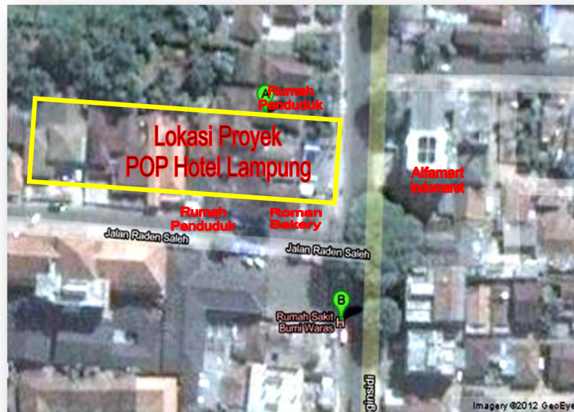
Gambar 3.1 Lokasi Proyek Pembangunan POP HOTEL Lampung