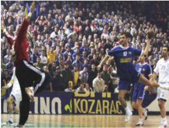
Gambar 1. Bermain Bolatangan

Pada umumnya permainan bolatangan berjalan dengan tempo yang cepat. Oleh karena itu seorang pemain bolatangan haruslah memiliki keterampilan yang baik. Pemain harus dapat melakukan gerakan lari dengan cepat, berlari dengan lincah/ tangkas, dapat menangkap bola dengan mantap, melempar ( mengoper ) bola dengan tepat ke sasaran. Selain itu juga pemain harus memiliki koordinasi tubuh yang baik serta menguasai beberapa cara penembakan bola. Dari garis besarnya, keterampilan dasar permainan bolatangan terdiri dari: 1) berlari, 2) menangkap bola, 3) mengoper bola, 4) mengiring bola menembakkan ke gawang.