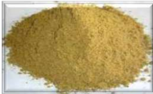
Gambar 3. Tepung ikan