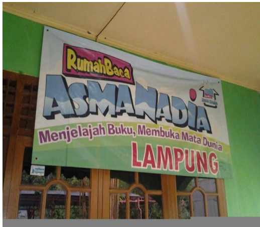
Gambar 2. Rumah Baca Asma Nadia

Lokasi penelitian adalah perpustakaan berkonsep komunitas di Bandar Lampung, yaitu Rumah Baca Asma Nadia Lampung, yang terletak Jl. Ikan Nila IX No. 18 Kelurahan Bumi Raya Kecamatan Bumi Waras Bandar Lampung.