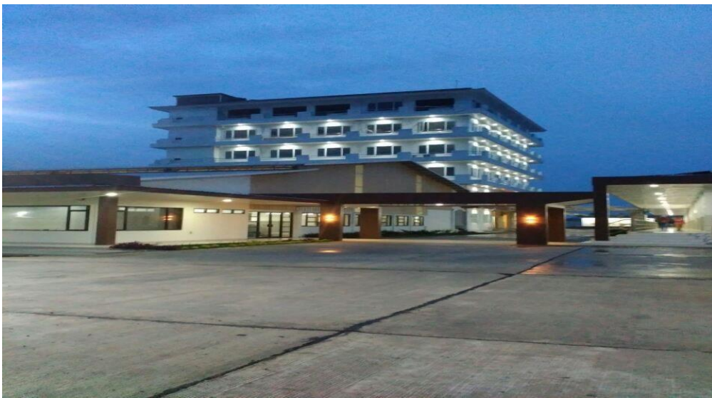
Gambar 3.1 Foto PT Indomina Langgeng Sejahtera