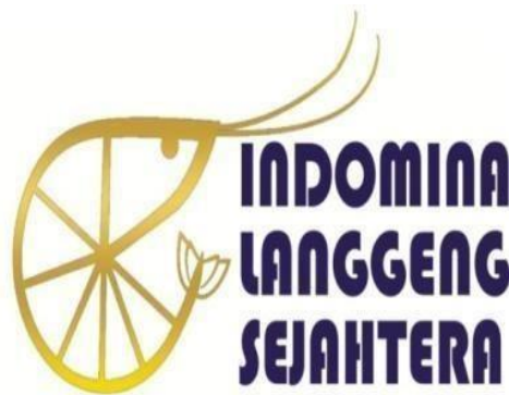
Gambar 3.2 Logo PT Indomina Langgeng Sejahtera

Seperti perusahaan pada umumnya, PT Indomina Langgeng Sejahtera juga memiliki arti nama perusahaan dan arti logo perusahaan. Arti nama perusahaan dan logo perusahaan ini didapat penulis dari hari wawancara antara penulis dengan HRD PT Indomina Langgeng Sejahtera. Adapun arti nama dan logo PT Indomina Langgeng Sejahtera sebagai berikut :