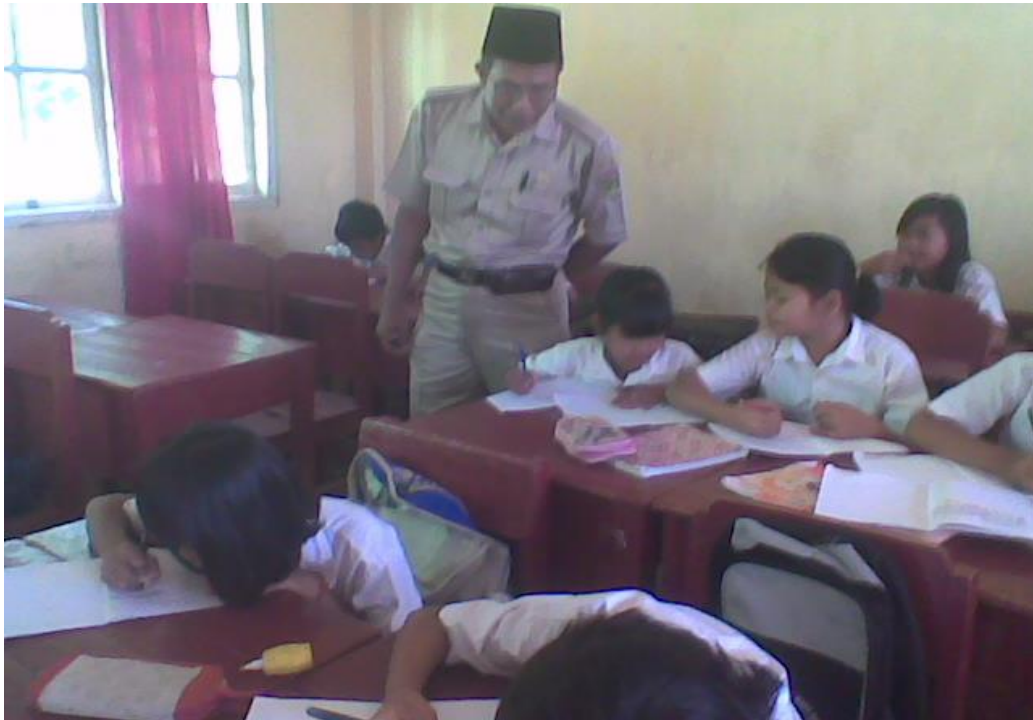
Siswa membacakan hasil pekerjaannya