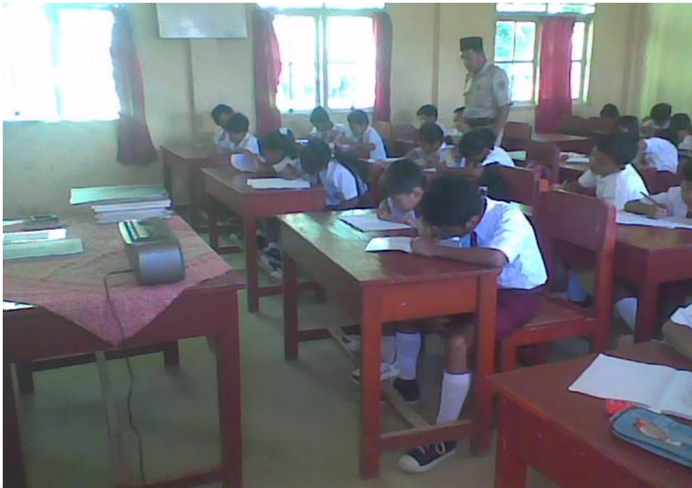
Siswa membacakan hasil pekerjaannya