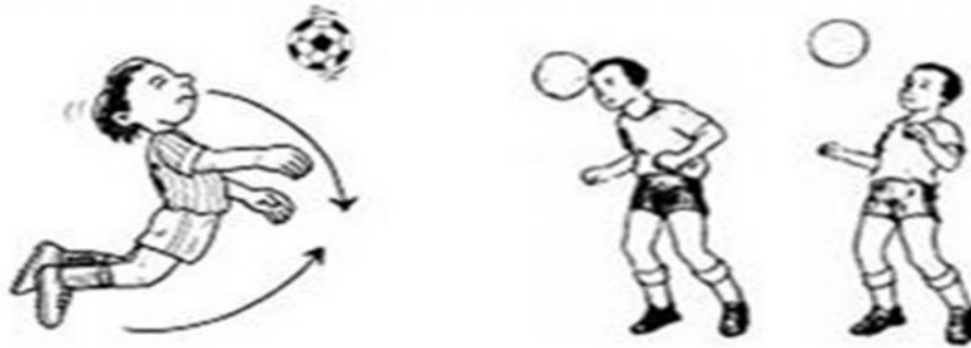
Gambar 4. Menyundul bola