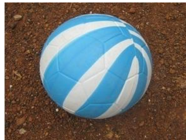
Gambar 2. Alat modifikasi dengan bola plastik dan bola karet.

Dalam penelitian ini, peneliti menggunakan bola plastik dan bambu rintangan. Bambu rintangan dibuat sepanjang 2 m dan bambu ini ditancapkan pada tanah agar dalam pelaksanaannya siswa dapat melewati bambu rintangan dengan menggiring bolaplastik