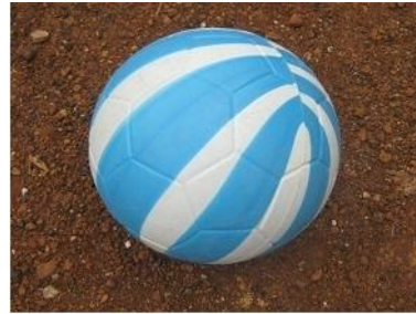
Gambar 2. Alat modifikasi dengan bola plastik dan bola karet.

Dalam penelitian ini, peneliti menggunakan bola plastik dan bambu rintangan.