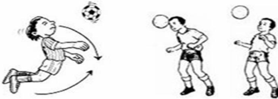
Gambar 4. Menyundul bola