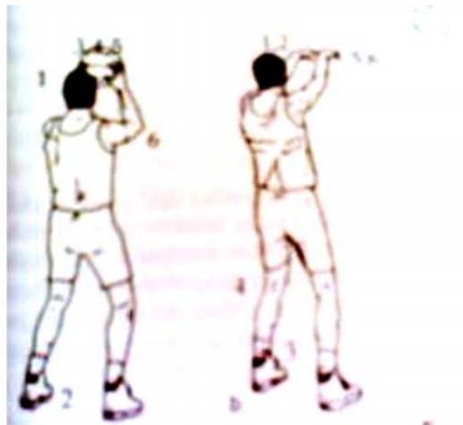
Gambar 1. Gerak Dasar Overhead Pass.

Bola basket termasuk jenis permainan yang kompleks. Untuk dapat bekerjasama dengan baik, tentu ia harus menguasai teknik melempar, menangkap, menggiring bola dengan baik. Passing atau operan merupakan salah satu teknik dasar yang dipelajari dalam permainan bola basket. Operan yang dilakukan harus taktis, tepat waktu dan akurat agar dapat berpeluang untuk membuat angka. Mengetahui saatnya mengoper, tidak hanya memberikan kesempatan untuk membuat skor tapi juga untuk mencegah kehilangan bola dari penjagaan lawan.