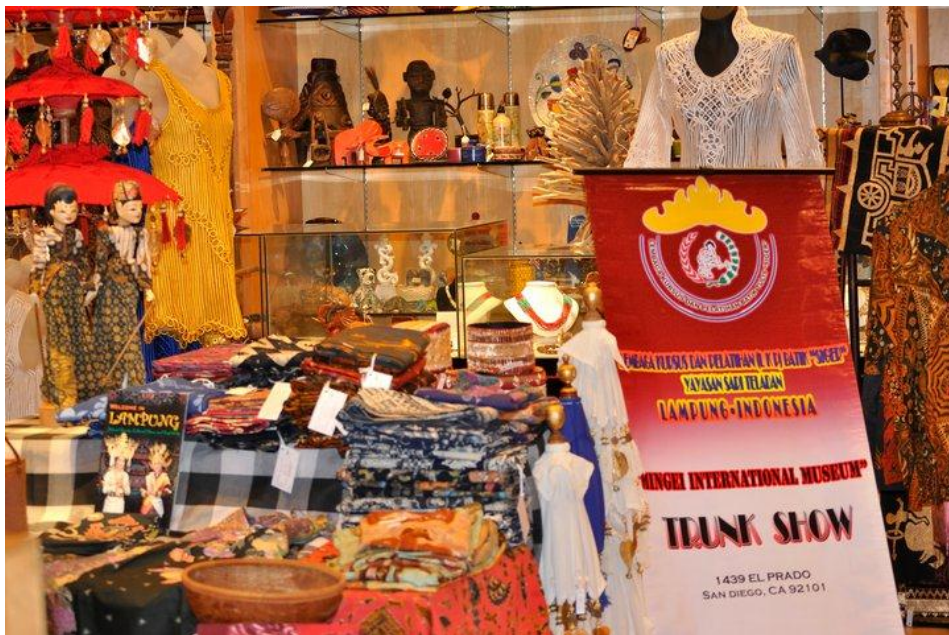
Gambar 7 : Internasional Trunk Show (Batik Siger)