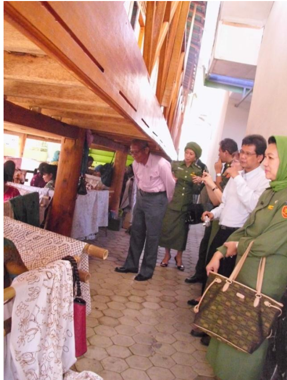
Gambar 10 : Kunjungan Dinas Pendidikan dan Kebudayaan ke LKP