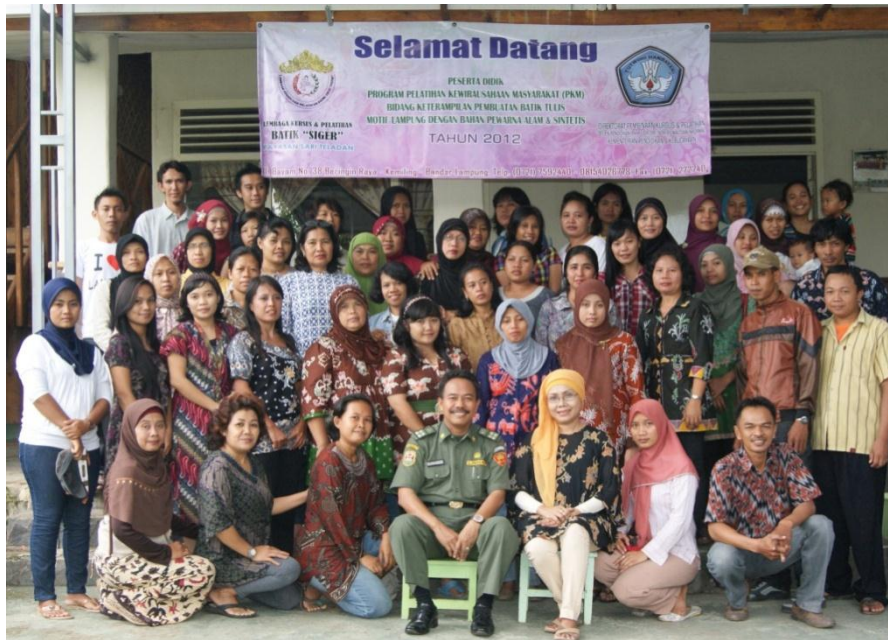
Gambar 8 : Peserta Batik angkatan 2012