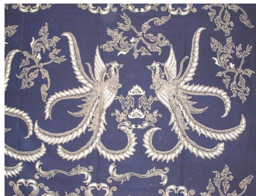
Gambar 11 : Motif Batik Siger