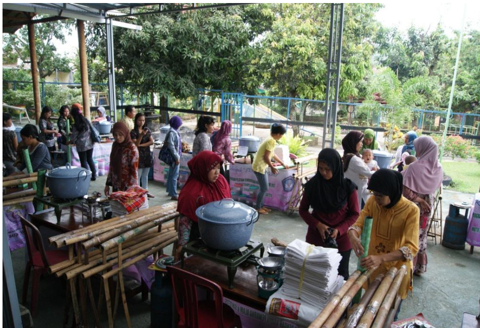
Gambar 9 : Kegiatan Peserta LKP Batik Siger Yayasan Sari Teladan