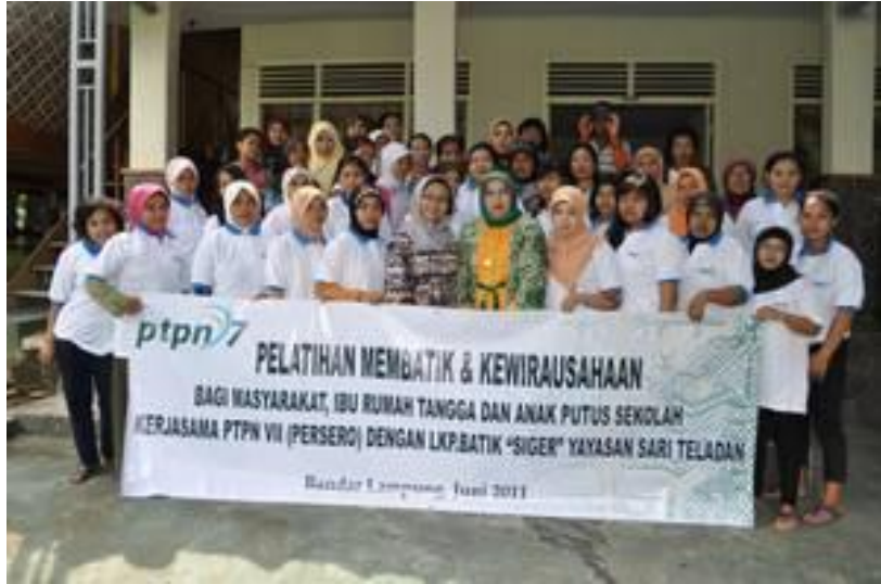
Gambar 6 : Peserta kemitraan kepelatihan Batik LKP Batik LKP Batik Siger Yayasan Sari Teladan angkatan 2011